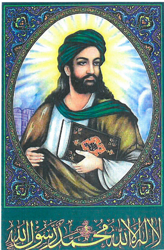
Fig. 15. MUHAMMED I sunni-islam har profetbil- leder altid været sjældne, og me- get få er med genkendelige ansigtstræk. I shia-islam er de derimod almin- delige. Under profetbilledet står trosbeken- delsen. Plakaten er fra Iran 1999.

Ud af Helvedes ild skal komme enhver, som har sagt: Der er ingen