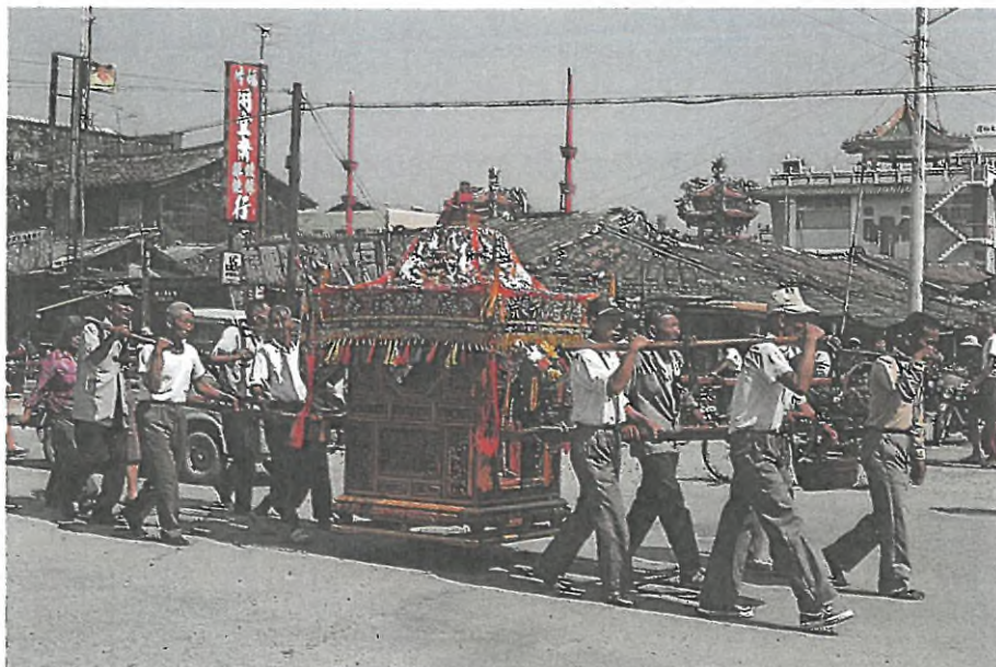
Xuejia (en by i Tainan amt, ca. 30 km nord for Tainan), 14/4 1978. Skytsguden ( Baosheng dadi ) bæres igennem gaderne under den årlige en-dags fødselsdagsfest.

Wanli (en mindre by i Tainan bydistrikt, ca. 7 km syd for Tainan), 10/10 1978. Afslutningen på en fem-dages jiao i et kvarter, hvis tempel er til Sanfu qiansui , en gruppe på tre wangye guder. Kongebåden, som her er en rigtig båd af træ, bæres gennem byen og ned til den nærliggende flod.