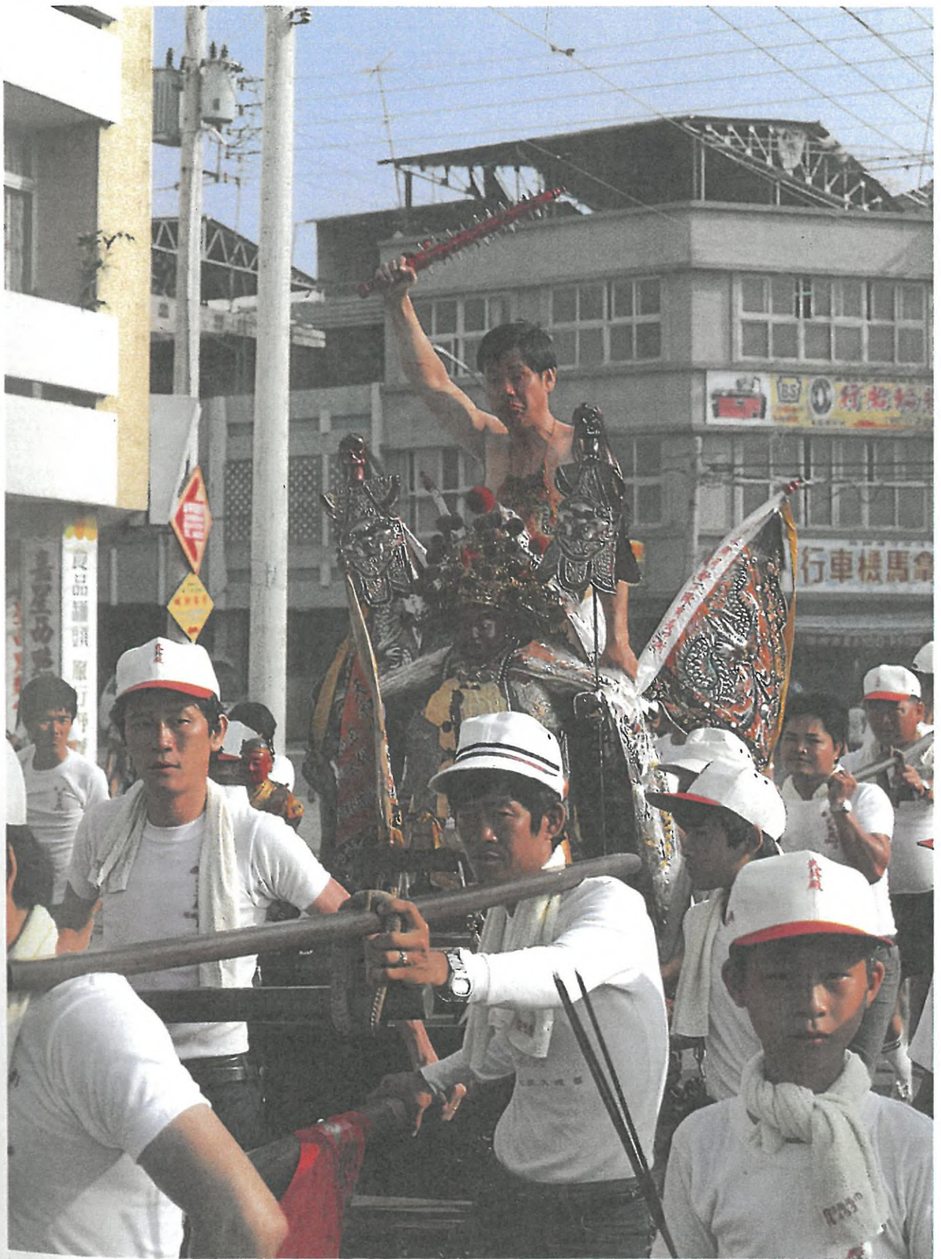
Tainan, som s. 52. I processionen, som bringer kongebåden ned til stranden, indgår en bærestol med en statue af guden. På ryggen af guden rider et medium, som har slået sig selv til blods med et pigget sværd. Det er den karakteristiske måde, hvorpå medier af denne type bringer sig selv i trance (se billedteksten s. 54).