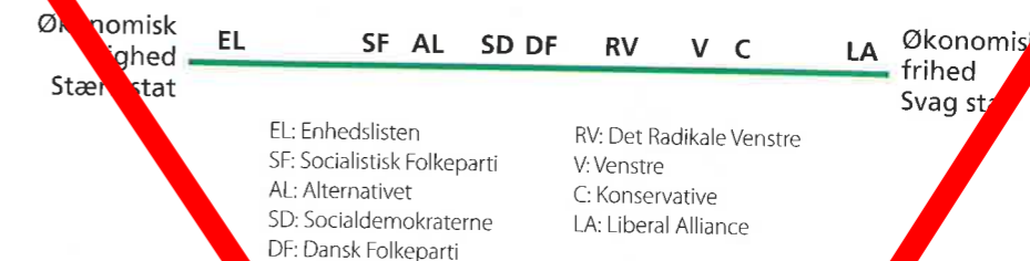
Figur 5.4 Danske politiske partiers placering på den fordelingspolitiske venstre-højre-akse

I den såkaldte adfærdstrekket (figur 5.8) kan man endvidere se, at de forskellige partier vægter faktorerne på forskellige måde. Partiernes ideologifaktor indeholder sjældent en af de tre klassiske ideologier i ren dyrket form – der er snarere tale om en af de ideologi-forgreninger, som vi omtalte i sidste afsnit. Til at give et indtryk af partiernes ideologiske placeringer anvendes traditionelt en fordelingspolitisk venstre-højre-akse, hvor den venstre pol står for økonomisk lighed og en stærk statsmagt, mens den højre pol udtrykker ønsket om økonomisk frihed og en begrænset statsmagt. Se figur 5.4.