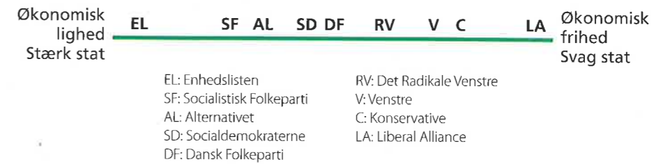
Figur 5.4 Danske politiske partiers placering på den fordelingspolitiske venstre-højre-akse

I den såkaldte adfærdstrekant (figur 5.8) kan man endvidere se, at de forskellige partier vægter faktorerne på forskellig måde. Partiernes ideologifaktor indeholder sjældent en af de tre klassiske ideologier i rendyrket form – der er snarere tale om en af de ideologi-forgreninger, som vi omtalte i sidste afsnit. Til at give et indtryk af partiernes ideologiske placeringer anvendes traditionelt en fordelingspolitisk venstre-højre-akse, hvor den venstre pol står for økonomisk lighed og en stærk statsmagt, mens den højre pol udtrykker ønsket om økonomisk frihed og en begrænset statsmagt. Se figur 5.4.