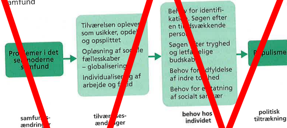
Figur 5.3 Populismens tiltrækningskraft på borgerne i det senmoderne samfund

Note: Figuren er udarbejdet af Jacob Graves Sørensen i "Ideologi og politik" af Hans Lystrup, Systime 1989.