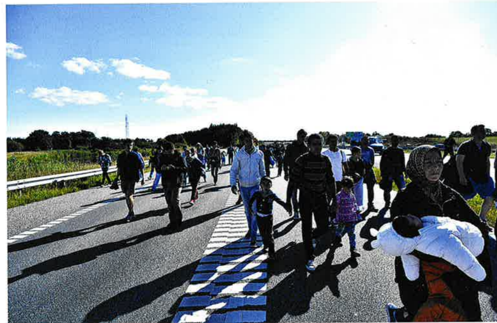
Flygtninge og migranter går på de sønderjyske motorveje, september 2015.

dres liv. Men politisk deltagelse handler også om, at borgeren gennem aktivt engagement lærer at udtrykke sig og forstå de politiske sammenhænge, hvormed borgere mægtiggøres og myndiggøres.