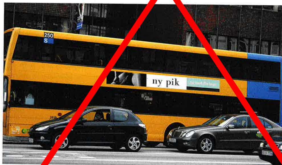
Det er ikke ualmindeligt at se reklamer for plastikoperationer i det offentlige rum. Billedet her er et manipuleret billede, som blev lavet af aktionsgruppen "Brysterne på bussen" i forbindelse med en kampagne for at få brystkirurgi ud af det offentlige rum.

kan forme vores krop efter bestemte ideer og ønsker, kan naturligvis diskuteres, men det tydeliggør Ziehes pointer om de individuelle muligheder i det senmoderne samfund. Der er dog en central pointe i Ziehes forståelse af, hvad der kendetegner det senmoderne samfund, og det er, at den måde, som mennesker forsøger at forme sig selv, som mennesker forsøger at forme sig selv, kan skabe for eksempel deres krop på, hvilket hen ad vejen er i overensstemmelse med samfundets dominerende