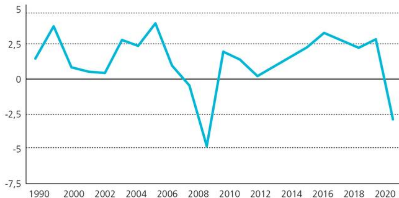
Figur 8.6: Udviklingen i Danmarks BNP. Realvækst i forhold til foregående periode. 1990-2020. Procent.

Note: Realvækst i forhold til foregående periode betyder, at man kigger på den årlige realvækst i procent fra det samlede BNP i for eksempel 2009 og til det samlede BNP i år 2010. Kilde: www.dst.dk .