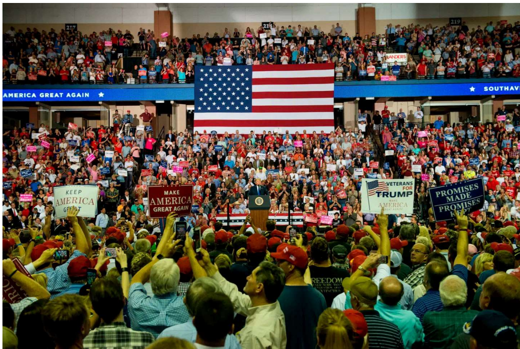
Donald Trump fylder salene, når han besøjer Mississippi.

Alligevel er optimismen stor hos de politikere, organisationer og virksomheder, som Berlingske møder i Mississippi.