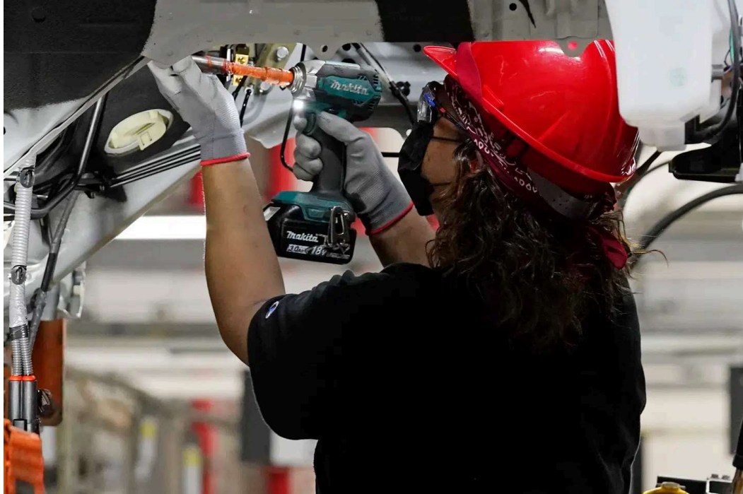
Nissan har siden 2003 været en af de største arbejdsgivere i Mississippi.

I dag beskæftiger Nissan knap 5.000 mennesker og har ifølge virksomhedens egne tal skabt op mod 25.000 job i staten.