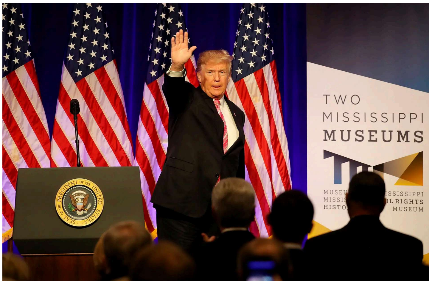
Den amerikanske præsident, Donald Trump, er umådelig populær i Mississippi. De tror på, at hans toldkrig fører gode tider med sig.