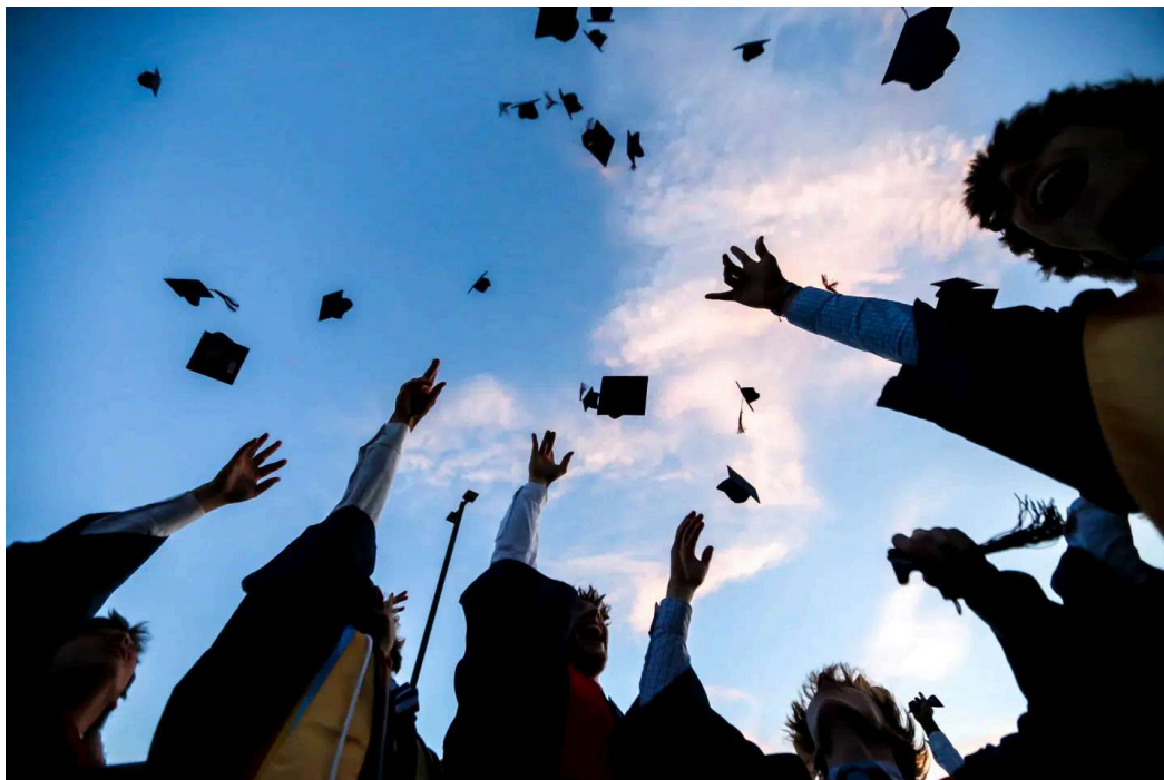
Studenter i Tupelo, Mississippi, fejrer deres eksamen i maj 2024. Staten vil have flere unge til at vælge tekniske uddannelser, fordi erhvervslivet efterspørger det.