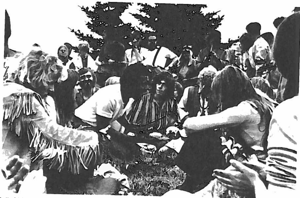
Fællesfølelsen kom de første dage især til udtryk ved improviserede musiksessions. (Thy-lejren 1970).

avis, en anden laver legelandskab til børnene, og efterhånden vil de fleste af de 20 store telte, som man har lejet af Civilforsvaret, blive aktivitets-centre. Teatergruppen »Secret Service« har overtaget ét af dem, Thys eget »verdensuniversitet«, som Beatle John Lennon gæstede i vinter, et andet. Ellers får folk travlt med at lære af hinanden (bl. a. at lave mikro-makro-mad) og læse alternativ-litteraturen (om østlig filosofi, stjernerne, revolutionen etc.). Der skal være noget meget smukt og eksotisk at se på i alternativ-samfundet. Skønheden dyrkes især af hippie-fløjen (»de smukke mennesker«), der klæder sig orientalsk og spraglet, sætter blomster i håret, maler sig på den bare krop og sælger smukt anrettede frugter. Lejrens telt er en orientalsk åbenbaring, og flere steder er man i gang med at indrette primitive bopladser med bambushytter og indianer-telte. Deltagerne var opfordret til at dekorere teltene hjemmefra, men tilsyneladende har de færreste fået lov