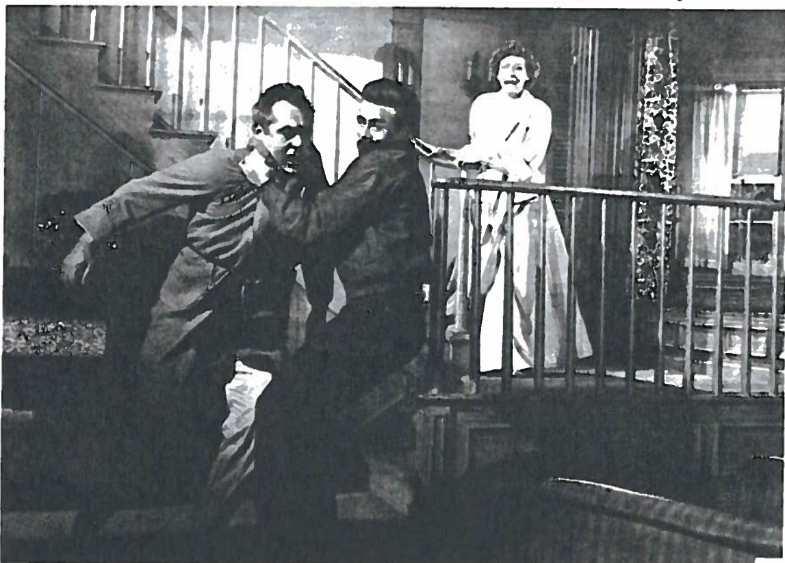
»Nu har vi gjort så meget for dig, og så viser du ikke engang taknemmelighed«. (Generationsmodsatning i James Dean-filmen Rebel Without a Cause . Warner-Metronome 1955).

Først og fremmest er det da flyttet fra familie til samfund. Det er derved blevet politisk på en anden måde end før. Thi traditionelt var også før i tiden den