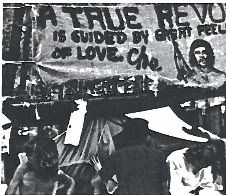
Den totale destruktivitet lader sig ikke logisk forbinde med begejstringer for Mao og Che Guevara. (Che i Woodstock. Warner-Metronome 1970).

mindre man som Cohn Bendit kalder alt, hvad man ikke kan acceptere for fascistisk.