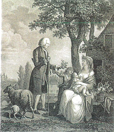
Jean-Jacques Rousseau eller Mennesket i Naturen. Udsnit fra et kobberstik fra ca. 1790.

Kilde: Die Sammlungen des Deutschen Historischen Museums. Her efter "Bilder und Zeugnisse der deutschen Geschichte 1" Blandt en hel række tænkere og forfattere er der tre, der kom til at øve stor indflydelse på den samfundsmæssige og politiske udvikling i både Europa og Amerika. Det er Montesquieu (1689–1755), Voltaire (1694–1778) og Rousseau (1712–1778).