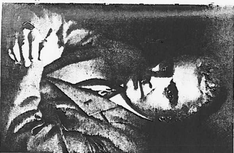
Ill. 9.1 John B. Watson (1878-1958)

og overvinde selv vanskelige opvækstvilkår. Man har kaldt dem overlevende eller mælkébøttebørn og har i de senere år talt om, at disse børn er i besiddelse af en særlig resiliens (modstandsdygtighed). Resiliensen er ikke kun noget, der er afhængig af det enkelte individs særlige ressourcer, men er også afhængig af det omgivende miljø. Der kan være tale om gode muligheder for støtte fra kompetente voksne eller støtte fra søskende, der gør, at et barn kan overvinde selv svære opvækstvilkår. De individuelle faktorer, der skaber resiliens, er blandt andet et positivt temperament, en tryk tilknytning, en tag-det-let-holdning til livet, god social opførsel og specielle talenter. Den største trussel mod barnets resiliens er omvendt manglen på voksenstøtte, en utryk tilknytning og tidlige skader, nogle gange allerede i fosterlivet – den, som følge af vantrøgt.