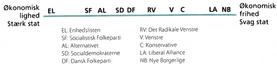
Figur 5.3 Danske politiske partiers placering på den fordelingspolitiske venstre-højre-akse

politisk parti ud fra partiets holdning til enkeltsagen (issuet) klima. Typiske politiske enkeltsager i dansk politik kan være spørgsmål om indvandring, skat, velfærd og kriminalitet.