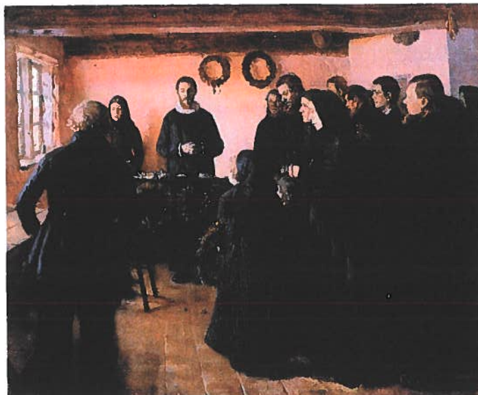
Anna Ancher (1859-1935): En begravelse (1891). Den realistiske stil dominerede dansk litteratur og billedkunst i perioden 1880-1900. Realismen beskæftigede sig med samtidige forhold og med fokus på især arbejderklassens vilkår.

Forfatterne Herman Bang (1857-1912) og Amalie Skram (1846-1905) viser, hvorfor mennesker bukker under for det borgerlige samfunds normer, og hvordan litteraturen kan være en stærk stemme i samfundsdebatten. Deres litteratur udspringer af et naturalistisk grundsyn, som ser litteraturen og teatret som et rum for eksperimenter, der kan udstille sociale problemer ved brug af realisme.