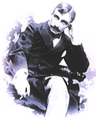
Herman Bang (1857-1912)

Det er svært at læse Herman Bang uden at se kampen for hans homoseksuelle rettigheder som en af drivkræfterne bag forfatterskabets store sociale engagement. At være homoseksuel blev i slutningen af 1800-tallet ikke blot opfattet som en sygdom, men også som umoralsk og ulovlig opførsel. Han var en af de første til at kritisere denne uretfærdighed. Bang opholdt sig ad flere omgange i eksil for at få fred fra den danske offentligheds hetz mod hans homoseksualitet. I lange perioder søgte Bang tilflugt i byerne Prag, Paris og i den seksuelle fristad Berlin. De homoseksuelle kæmper han for gennem antydninger i sine tekster. Han må dække sig ind bag kvindens situation og bliver en stærk stemme for kvindens frigørelse. På denne maskerede måde er Bang blevet en pioner for dansk litteratur med 'queer'-perspektiv – et engelsk begreb, der først defineres med kønsforskningen i 1990'erne.