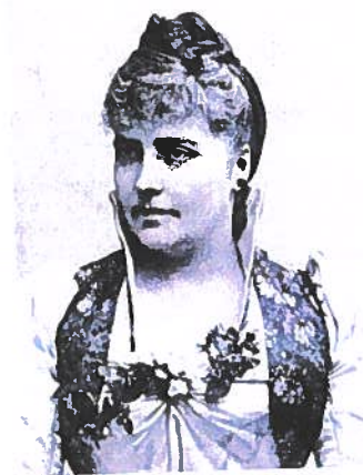
Amalie Skram (1846-1905)

Amalie Skram blev født i Bergen i en familie fra den lavere middelklasse og havde oplevet fattigdommens snærende bånd. Hendes far var småhandlende, gik fallit og flygtede til Amerika. Familiens trange kår betød, at hun allerede som 17-årig giftede sig med en kaptajn, der kunne forsørge hende. De rejste rundt i verden og fik to sønner, men efterhånden opholdt hun sig mest i Bergen frem til deres separation i 1877. I Bergen var hun en stærk skribent i det radikale miljø omkring teatret og Bergens Tidende, hvilket bragte hende til København i 1884. Her var hun i en årrække gift med forfatteren Erik Skram (1847-1920), der støttede hende i de år, hvor hendes forfatterskab tog fart.