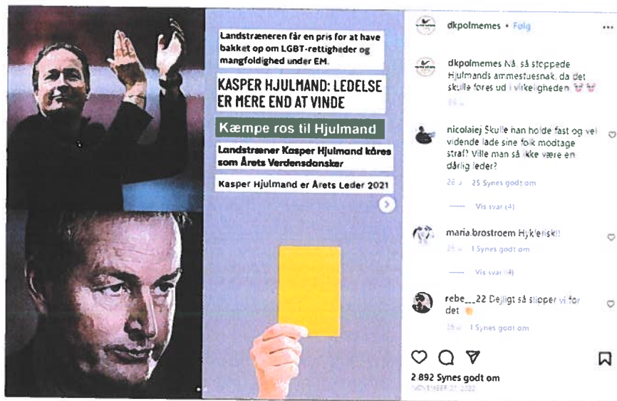
Kasper Hjulmand-meme: 21.11.2022.