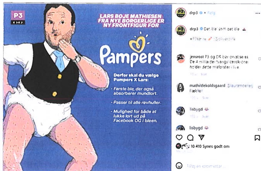
Meme med Lars Boje Mathiesen, medlem af Folketinget, kortvarig formand for partiet Nye Borgerlige, men nu losgænger.

gratis menstruationsbind til kvinder ironisk spurgte, om der så også skulle "være underbukser på offentlige toiletter, hvis jeg går en tur og spontant skider i mine bukser?". Kommentaren satte gang i en shitstorm på de sociale medier – blandt andet kritiserede flere kvinder ham for ikke at kende til, hvordan en menstruerende krop fungerer. DR gjorde på Instagram-profilen drp3 sagen til et udgangspunkt for et meme, hvor Boje blev fremstillet som en person, der har svært ved at holde på sin afføring, og som derfor selv kunne have gavn af tilbuddet om gratis hygiejneprodukter. Ordene "røvhuller" og "mundlort" peger på det yderst ironiske ved, at en folkevalgt politiker, der ovenikøbet fungerede som sit partis ligestillingsordfører, ikke i tilstrækkelig grad formåede at anerkende de udfordringer, der er forbundet med det at være menstruerende kvinde. På den måde begår memet karaktermord på Boje ved at fremstille ham som et usympatisk "røvhul", der udtaler sig om ting, han dybest set ikke ved noget om, men som man forventer, han burde kende til.