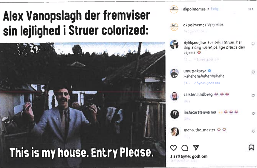
Alex Vanopslagh-meme: 21.09.2022.

der ger, kri- len i 021, or at eder ordi pa- -og