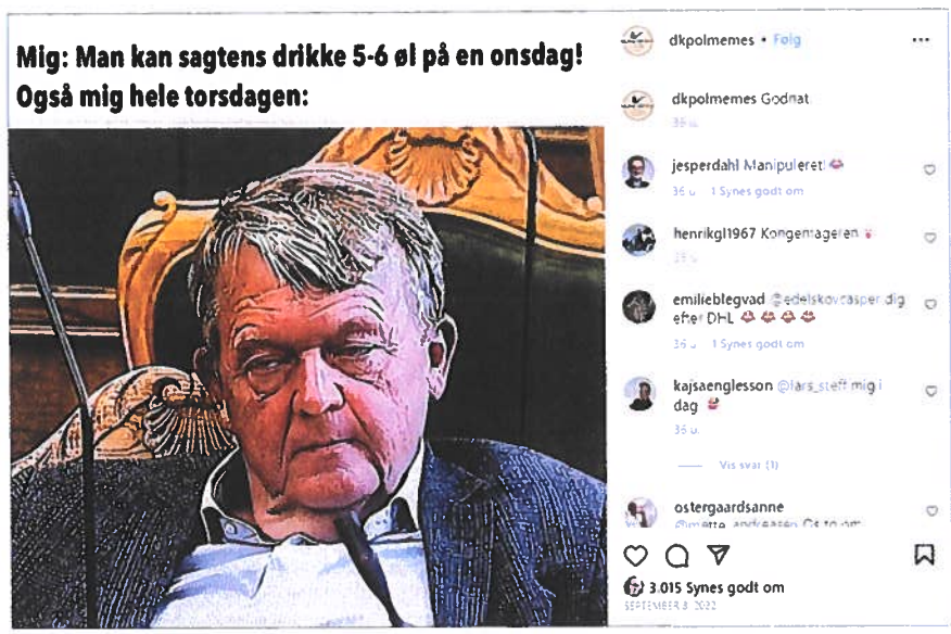
Lars Løkke Rasmussen-meme: 08.09.2022.