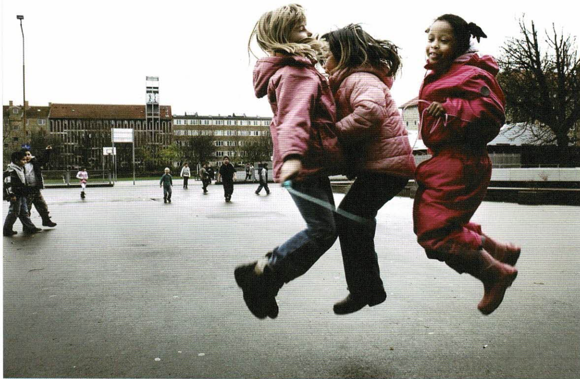
Er skolen inkluderende eller ekskluderende?

Merton mener, at det er afgørende for, at et samfund kan opstilles der de nødvendige muligheder for alle klasser i samfundet. Individer i samfundet har forskellige muligheder for at opnå de nødvendige goder. Merton siger, at personer i de dårlige klasser i samfundet er et udtalt eksempel på, at de ikke har de nødvendige muligheder for at opnå de nødvendige goder og de nødvendige midler til at opnå dem. Dette er en afvigelser fra den kriminologiske norm. Dette er en afvigelser fra den kriminologiske norm. Dette er en afvigelser fra den kriminologiske norm. Dette er en afvigelser fra den kriminologiske norm.