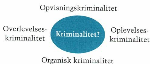
FIGUR 2.2. SNAP-MODELLEN – EN GENEREL TEORI OM CENTRALE KRIMINALITETSFAKTORER II.