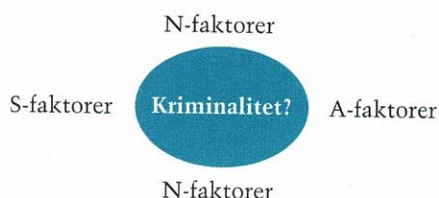
FIGUR 2.1. SNAP-MODELLEN – EN GENEREL TEORI OM CENTRALE KRIMINALITETSFAKTORER I.