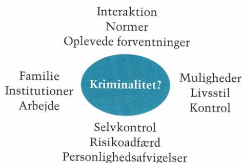
FIGUR 2.3. SNAP-MODELLEN – EN GENEREL TEORI OM CENTRALE KRIMINALITETSFAKTORER III.

Hver af de fire SNAP-faktorer kan siges at indeholde forskellige variable, der i særlig grad har betydning for kriminel adfærd. De variable kan opstilles således: