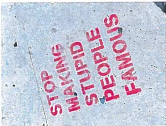
Ser du reality tv? Deltagerne i sådan et show kan være en referencegruppe for dig!

identifikation med de rollemønstre, du omgås, og på denne måde tillægger man sig den adfærd, der forventes.