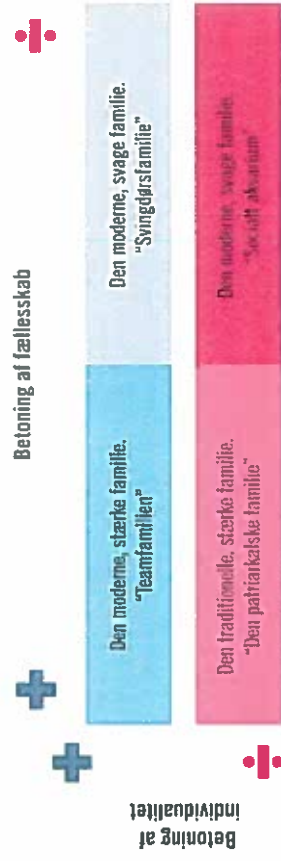
FIGUR 1.2 Familietyper i det moderne samfund

KILDE: VICTOR BURKHSTRUP, OLIVER SKOV OG TOBIAS MATTHESEN. "SAMF PÅ B" (COLUMBUS 2016)