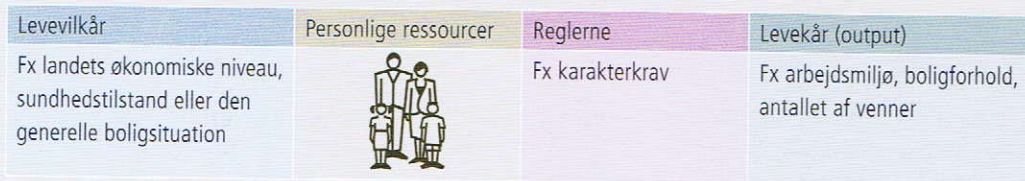
FIGUR 1.4 ULIIGHEDEN I ET SAMFUND – HVEM BÆRER ANSVARET?

Note: Inspireret af „Udviklingen af befolkningens levekår over et kvart århundrede“ SFI, 2003, side 35.