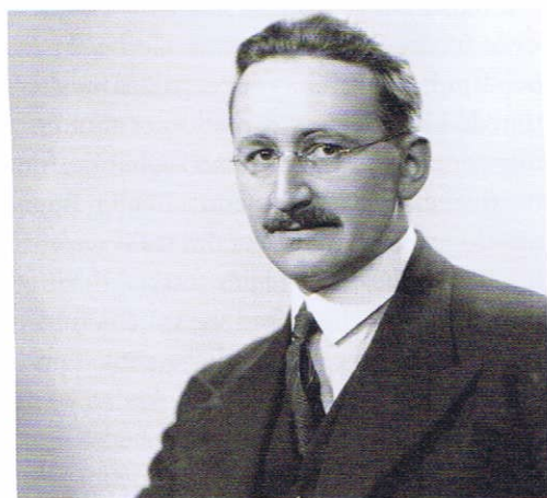
Friedrich August von Hayek (1899-1992).