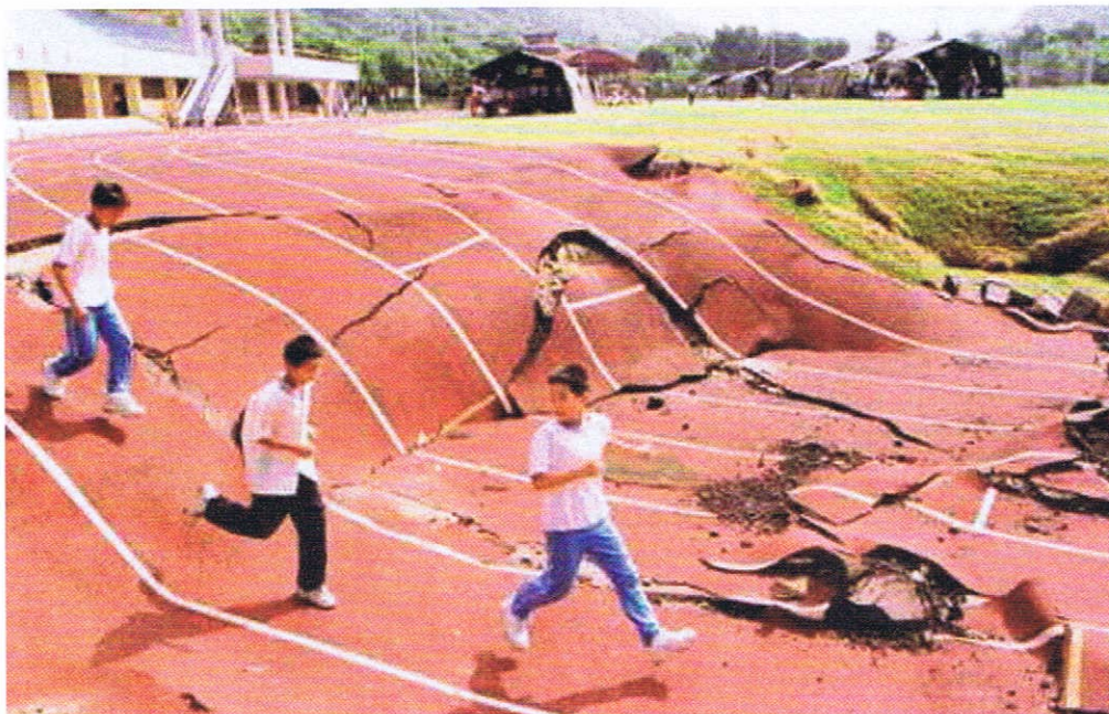
En nedbrudt løbebane. Et billedligt udtryk for Marx' argument om, at den eneste måde at skabe et mere lige og retfærdigt samfund var ved at nedbryde det kapitalistiske system (nedbryde løbebanen).

Spørgsmålet er, hvordan det nye system så skulle se ud? Hvis de sociale fællesskaber, som har formet os, samtidig undertrykker os, hvordan kan vi så etablere et nyt og mere lige fællesskab uden undertrykkelse. Af Det Kommunistiske Manifest fra 1848 fremgår det, at arbejderklassen skal erobre statsmagten fra kapitalisterne, (bourgeoisiet). Når revolutionen er tilendebragt, overgår al ejendom til statens eje, og produktionen kommer på fælles hænder. Marx kalder dette for den socialistiske stat eller for „proletariatets diktatur“ (se også kapitel 6, figur 6.3), men dette er kun en