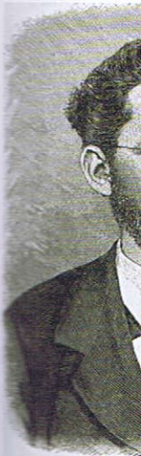
Eduard Bernstein Tysk socialistisk

lyd for. Berns skulle accept og kæmpe for met. Bernstei Karl Marx har punkter. Fx h det dårligere o sagde, og klas blevet skærpe ordnede forho sociallovgivni