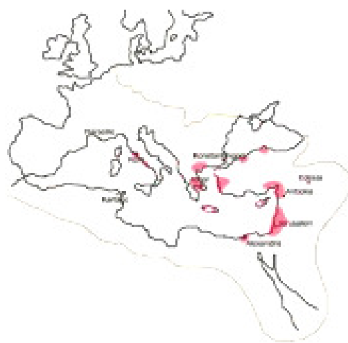
Områder med kristne menigheder omkring år 100