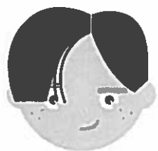
MICHAEL STRUNGE (1958 -1986)

Oh, natkiosk og ciggies og bænke hvor kroppen kan hvile. Åh, storlyd af handlinger der spænder deres stjerneskind ud på himlens maveskind! Åh, spændte knalddrømme nattesene synsorgasmer åh, riv mine molekyler fra mig og del mig ud som aske og pot til dem der vil bruge et liv til sager som strittende lyde og jublende lir... Når byen elskes af himlen og stjernerne trækker tårestriber fra vindue til vindue når menneskene er til for hinanden, revnfærdige af jordsyge.