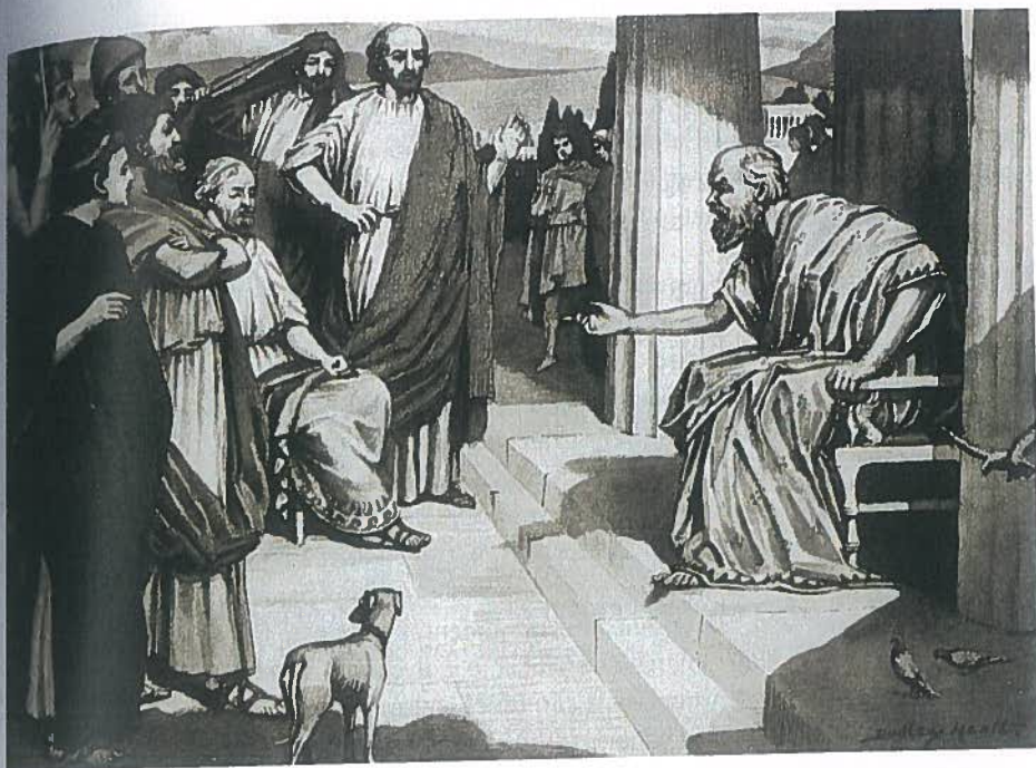
Den græske filosof Sokrates (469-399 f.v.t.) forsøgte at hjælpe andre med at undersøge deres egne argumenter, så de selv kunne indse, hvilke mangler der var i dem. Sokrates' tanker er primært bevaret af hans elev Platon.

Generaliseringsargumentet: Her argumenteres der med, at det, der gælder for enkelte medlemmer af en gruppe eller klasse, gælder for dem alle. Generaliseringsargumentet er det modsatte af klassifikationsargumentet. Her sluttes der fra del til helhed. Jo flere medlemmer generaliseringen bygger på, og jo mere repræsentativ udvalget er, jo mere troværdig bliver generaliseringen. Hvis man blot generaliserer ud fra et enkelt eller nogle få eksempler, stiger utroværdigheden let (alle piger sladrer, jeg kender selv én, der gør det), men på den anden side kan enkelte og velvalgte eksempler på et fænomen ofte virke mere overbevisende end statistik.