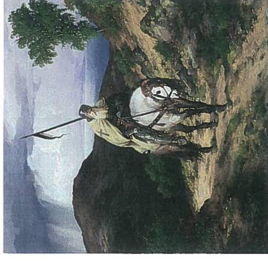
91. Den sidste korsridder. Maleri af Karl Friedrich Lessing (1808-1880).

Korstogene bliver ved med at optage os – og måske også at skræmme os. Men som moderne iagttagere må vi i højere grad forsøge at forstå korstogene på baggrund af deres rette historiske sammenhæng og som det særlige middelalderfænomen, de var. Det kan vi blandt andet også forsøge ved læsning af kilderne, hvor korstogstidens hovedpersoner stadig taler til os igen – nem århundrederne. Og derfor opfordrer vi læseren til på egen hånd at gå ind på hjemmesiden tilknyttet denne bog og læse kilderne og dermed sætte sig yderligere ind i perioden.