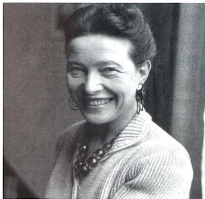
Simone de Beauvoir.

"Man fødes ikke som kvinde – man bliver det," skrev den franske filosof Simone de Beauvoir i bogen Det andet køn fra 1949. Beauvoir ændrede rammerne for at diskutere køn. Hendes hovedargument var, at køn ikke var noget biologisk betinget, men derimod en rolle, som var et resultat af en bestemt opdragelse. Man blev socialiseret til at opføre sig som en dreng eller pige. Køn er en social konstruktion og ikke no-