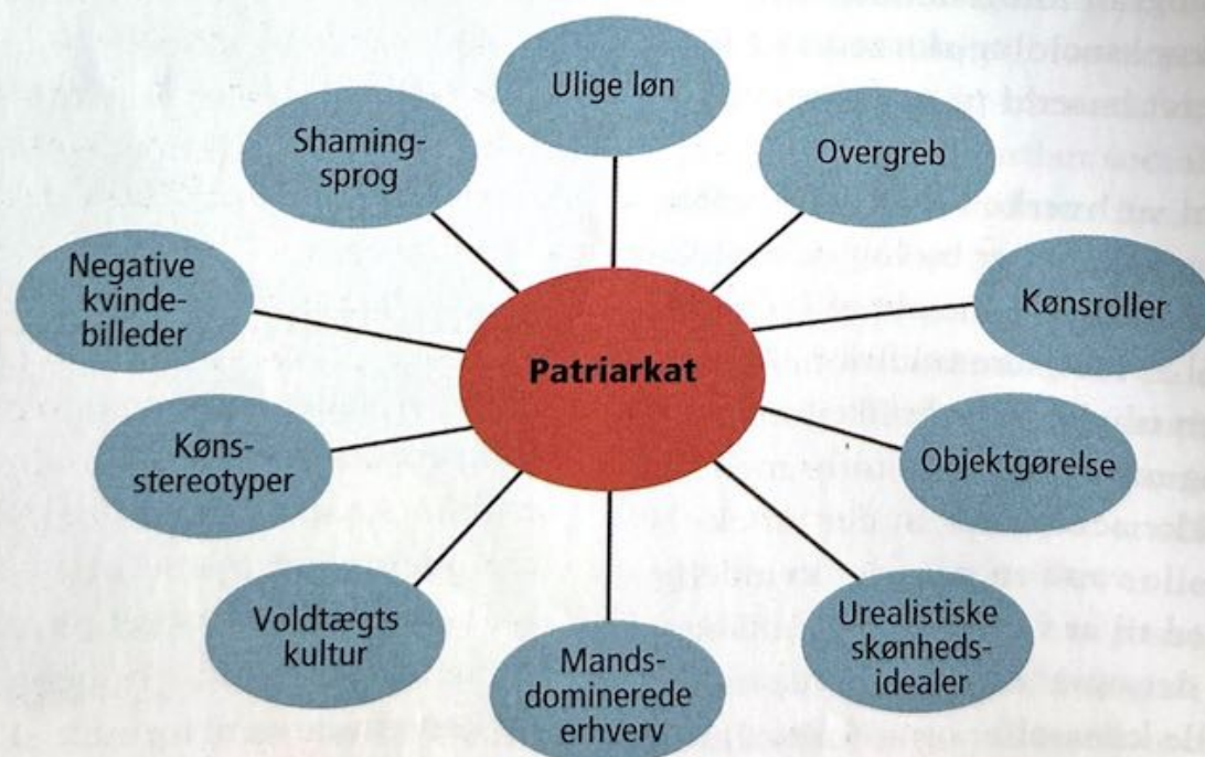
FIGUR. 1.15 PATRIARKATET

Patriarkatbegrebet er også blevet kritiseret fra forskellige sider. Nyere kønsso-ciologer mener, at patriarkat-tanken hviler på en falsk ide om mænd og kvinder som en eviggyldig modsætning, og at teorierne overser homoseksuelle og transkønnede personer, der ikke passer ind i kategorierne 'kvinder' og 'mænd'. Andre mener ikke, at ideen om patriarkatet giver et retvisende billede af kønnenes magtfor-