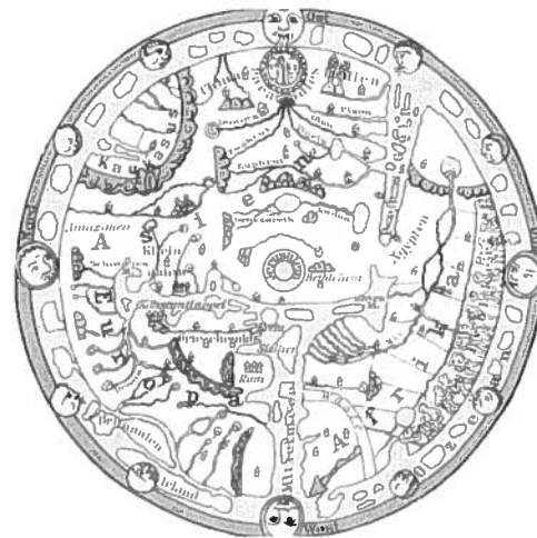
d) 1200-tallets kristne verdenskort – her gengivet efter en engelsk salmebog – stod ved magt i folkelige kredse renæssancen igennem.

* Alene de spanske kolonier leverede således i regnskabsåret 1545/46 5500 kg guld af en samlet verdensproduktion på 8500 kg, og verdensproduktionen af sølv, der omkring 1500 lå på ca. 47.000 kg årligt, var omkring 1600 steget til 423.000 kg, hvoraf de 390.000 kg kom fra spansk Amerika.