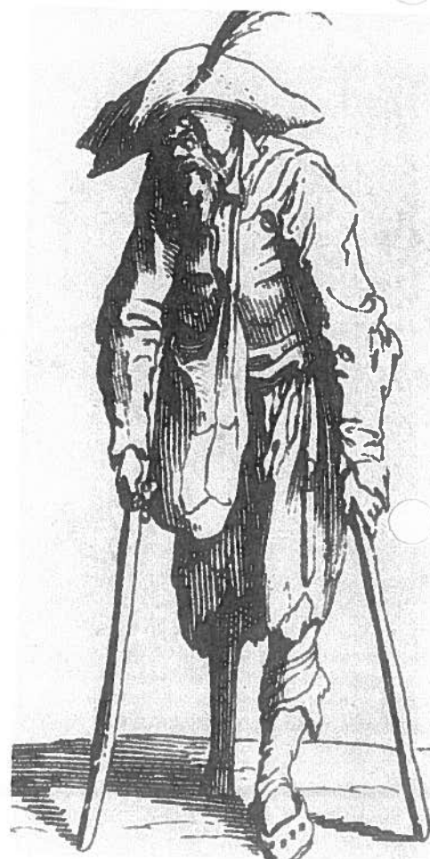
Ill. 10: En invalid stakkel (ordet kommer af stavkari) støtter sig her frem ad landevejen. En krigsveteran fik ingen pension, men måtte tigge sig gennem resten af tilværelsen. Radering af Jacques Callot, 1630'erne.

Imidlertid er borgerskabet ikke »folket« i renæssancen. Flertallet udgøres af bønder. Og for dem er renæssancen ikke en glørværdig opgangstid. »Prisrevolutionen« udhulede i 1500-tallet såvel bøndernes som almindelige lønarbejders købekraft, og godsejerne udnyttede højkonjunkturen til at opkøbe mere jord, således at de frie bønder enten blev fæstere eller måtte rejse til byerne. Og derinde kunne de fleste som ufaglært arbejdskraft i manufakturerne kun forvente at få sultelønninger, idet et af merkantilismens principper var at holde produktionsomkostningerne på det lavest mulige niveau. Da så kriser og krige for alvor satte ind i 1600-tallets Europa, måtte op mod 10% af befolkningen friste tilværelsen som vagabonder på landevejene.