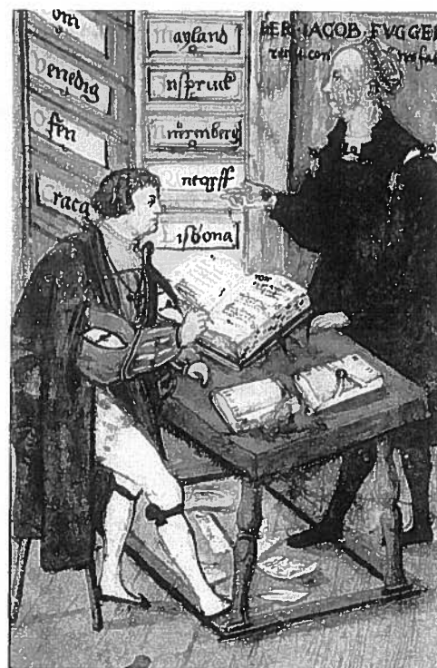
Ill. 7: 1500-tallets erhvervsrigter var familierne Medici og Fugger. I billedet af Jacob Fugger fra 1516 har verdensligheden og materialismen sejret helt. Storkapitalisten Fugger er skildret på sin arbejdsplads, det mægtige handelshus i Augsburg, i færd med at diktere til sin flittige bogholder Matthäus Schwartz, der har lavet billedet. Jacobs hånd peger samtidig »diskret« på arkivskabet i baggrunden med navnene på verdensfirmaets datterselskaber i Rom, Venedig, Østen (?), Krakow, Milano, Innsbruck, Nürnberg, Antwerpen og Lissabon.

Allerede i den tidlige renaissance finder vi de typiske repræsentanter for denne nye »herskerklasse«. I Firenze hvilede rigdommen som nævnt på tekstilproduktionen, og derfor lå den politiske magt hos håndværker- og købmandslavene. De valgte byens råd, signoriaen. Blandt købmændene hævdede Medici-familien sig efterhånden – ved støtte fra byens lavere sociale stænder – til at opnå kontrol med signoriaen og derved få en fyrstestemme over byen. Magten var vundet på machiavellisk vis (p. 68ff.) bl.a. ved at ruinere politiske modstandere gennem mediciernes kontrol med skattevæsenet, men typisk for renessancefyrsten manifesterede magten sig i en ægte interesse for og sponsorstøtte til kunsten og videnskaben, der i Cosimo og Lorenzo Medicis regime (1434–1492) fik sin gyldne tid med kunstnere som Brunelleschi, Rafael og Michelangelo (p. 88ff., 95ff., 103). Den senere renessances arvtagere til denne højborgerlige kultur blev Nederlandene og England.