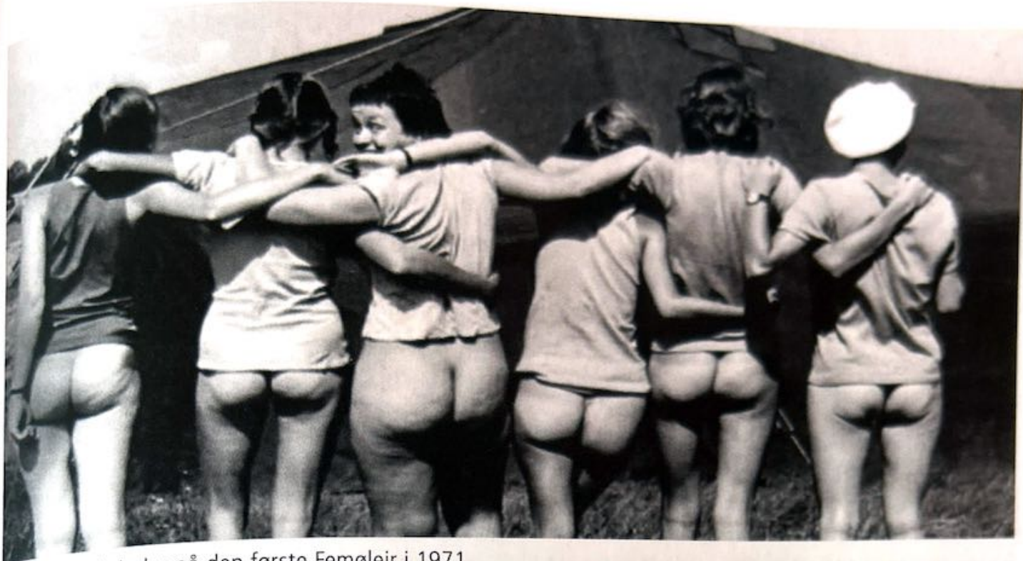
En gruppe kvinder på den første Femølejr i 1971.

binde kvinder sammen. Derfor kaldes rødstrømpebevægelsens politiske tilgang også identitetspolitik .