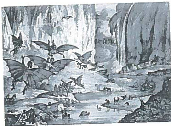
Figur 4.1 Great Moon Hoax Med historier om opdigtede flagermusemennesker på månen forsøgte The Sun med stort held at sælge flere aviser i 1835.

Det var ikke kun prisen, han underbød. Det eneste og afgørende kriterium for historierne var, hvor mange aviser de kunne sælge. Også dengang var det i høj kurs at bringe sensationelt, dramatisk og saftigt kriminalstof for at sælge aviser. Med beretninger om flagermusemennesker på månen gik The Sun skridtet videre end tabloide sensationshistorier for at få flere læsere.