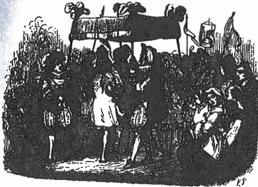
HC Andersen: Kejsarens nye klæder, 1837.

Fortolkningen kan bevæge sig et skridt videre og sætte teksten i relation til noget uden for teksten selv og dermed til den kontekst , den er skrevet ind i. Man kan f.eks. se teksten i lyset af, hvilken historisk periode den er fra, hvem forfatteren er, hvilken genre den tilhører, hvilke andre tekster den ligner osv. Man taler da om, at man perspektiverer teksten. Ofte er det først, når man på denne måde ser teksten i lyset af en større kontekst, at man bliver helt klar over, hvilke fortolkningsmuligheder der ligger i teksten.