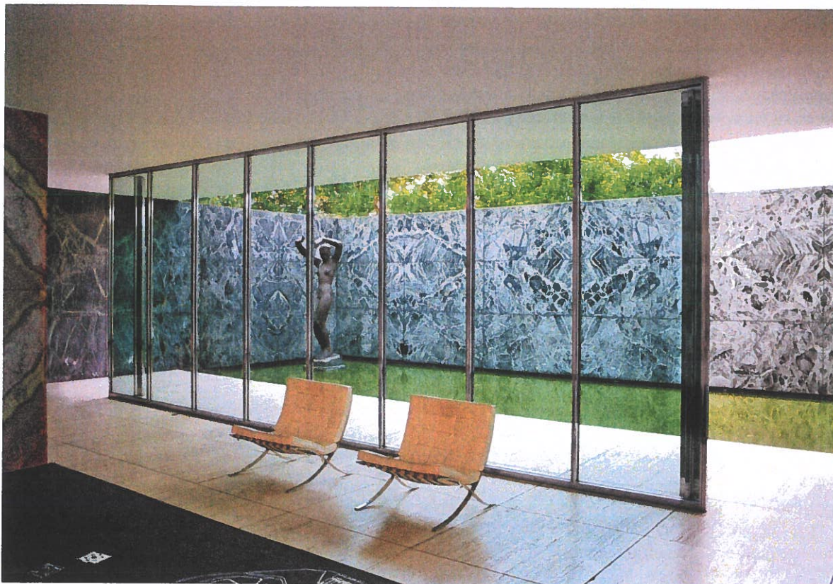
Ludwig Mies van der Rohe: Barcelona-pavillonen , 1929, genopført 1986