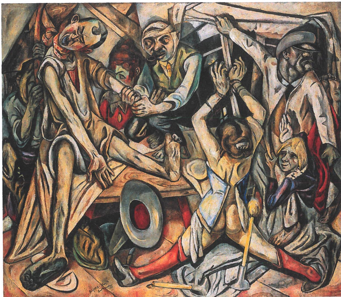
Max Beckmann: Natten , 1918-19. Olie på lærred, 133 x 154 cm

Danmark kommer snart til at opleve problemer, der især rammer arbejdere og småborgere. I oktober 1929 indtræffer den såkaldt sorte tirsdag, børskrak-