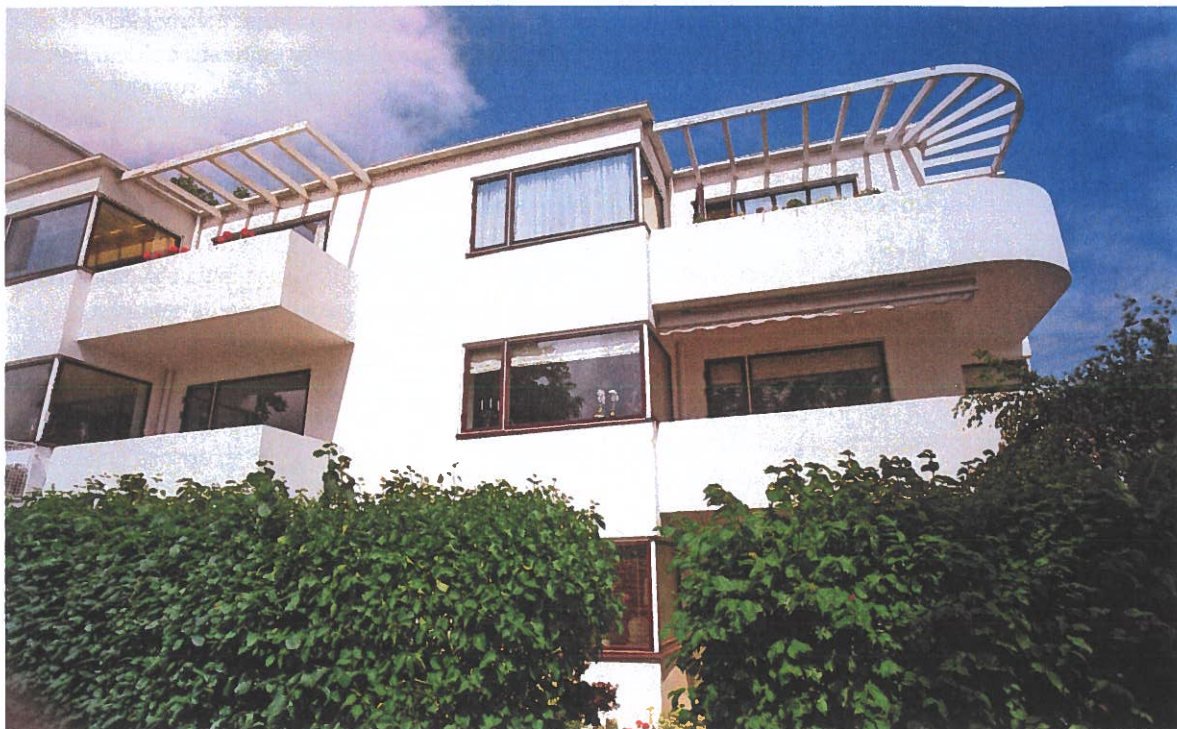
Arne Jacobsen: Bellavista , Klampenborg, opført 1933-34