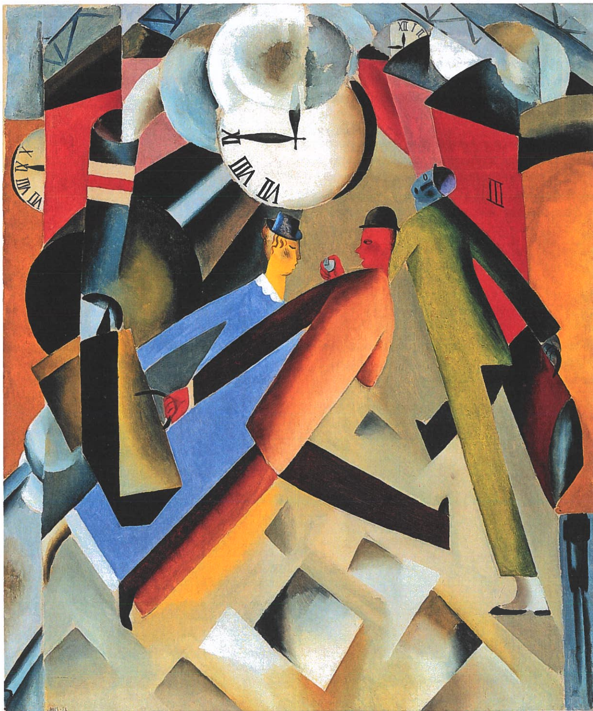
Jais Nielsen: Afgang , 1918. Olie på lærred, 120 x 100 cm

Her bliver Rådhuspladsen til noget helt andet end et geografisk sted. Det bliver en krop, en organisme, som digteren føler sig i overensstemmelse med. Han lovpriser ekstatisk, og markiserne råber ham deres svar. Her er stemningen 'højt humør' fortolket ud i verden i en ekspressionistisk jubel, en hyldest til det liv, som alt omkring ham deltager i. Skellet mellem døde og levende ting er ophævet, digteren har