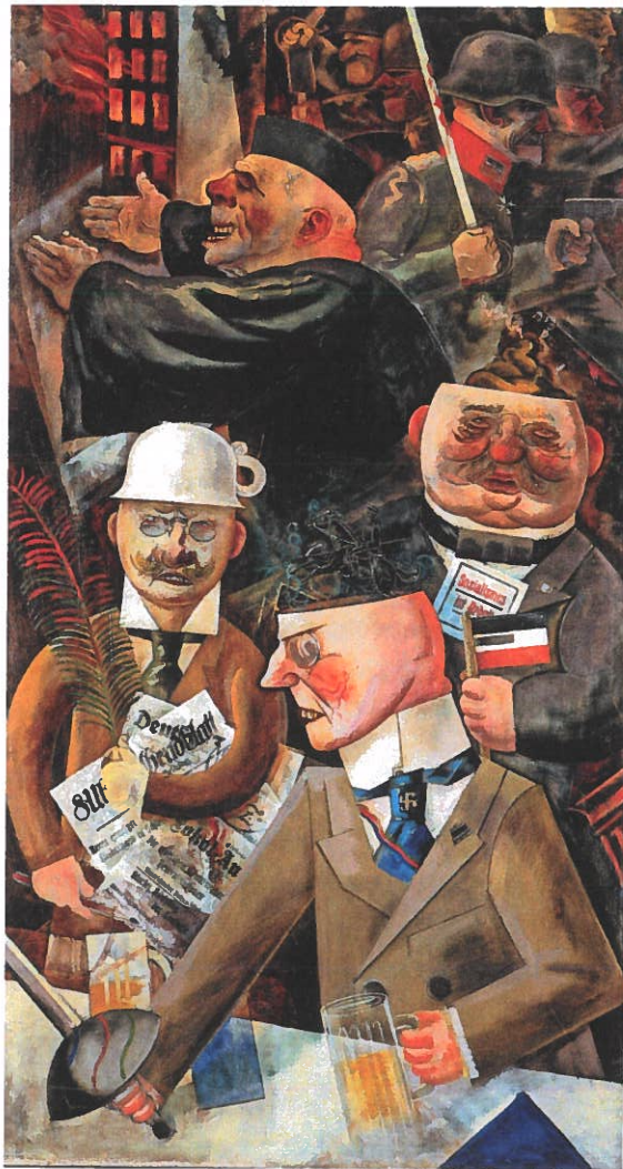
George Grosz: Samfundsstøtter , 1926. Olie på lærred, 200 x 108 cm

Efter skandalen og bortvisningen fra skolen søger Kokoschka til Berlin, hvor der også er et ungt og rebelsk kunstnermiljø inden for alle kunstneriske genrer. I det hele taget bliver Berlin på mange måder 20'ernes kulturelle hovedstad. Her falbydes død, sex, perversioner og stimulanser af enhver slags. Livet synes at udfolde sig efter parolen: efter os