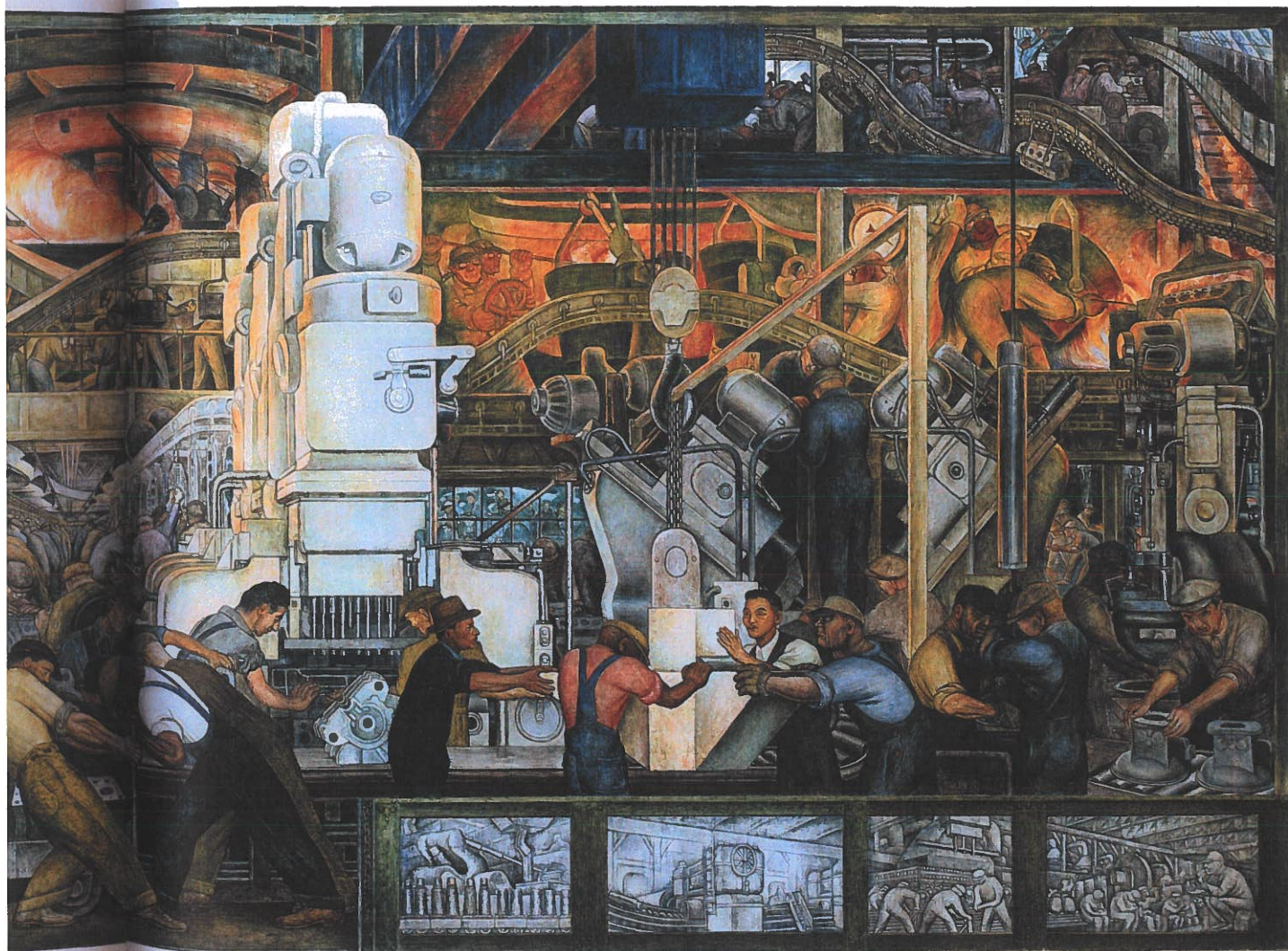
Diego Rivera: Menneske og maskine , 1932-33. Fresko