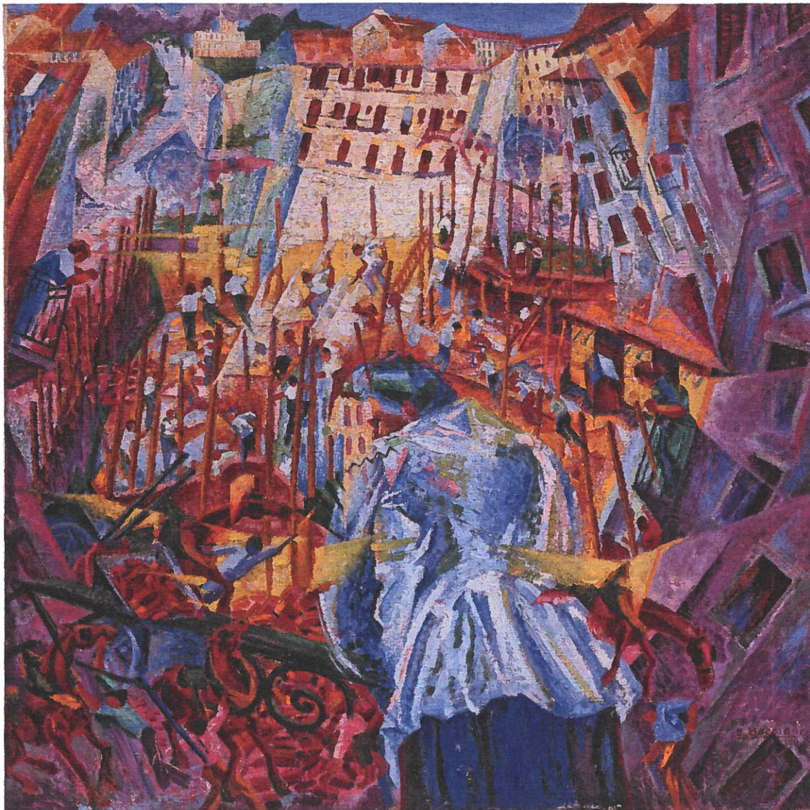
Umberto Boccioni: Gadens larm trænger ind i huset , 1911-12. Olie på lærred, 100 x 100,5 cm

Første Verdenskrig kunne det forståeligt nok være svært at opfatte den vestlige kultur som præget af kristne dyder, af næstekærlighed og omsorg for den svage. Snarere synes verden regeret af penge, maskiner og løgnagtige og autoritære ideologier.