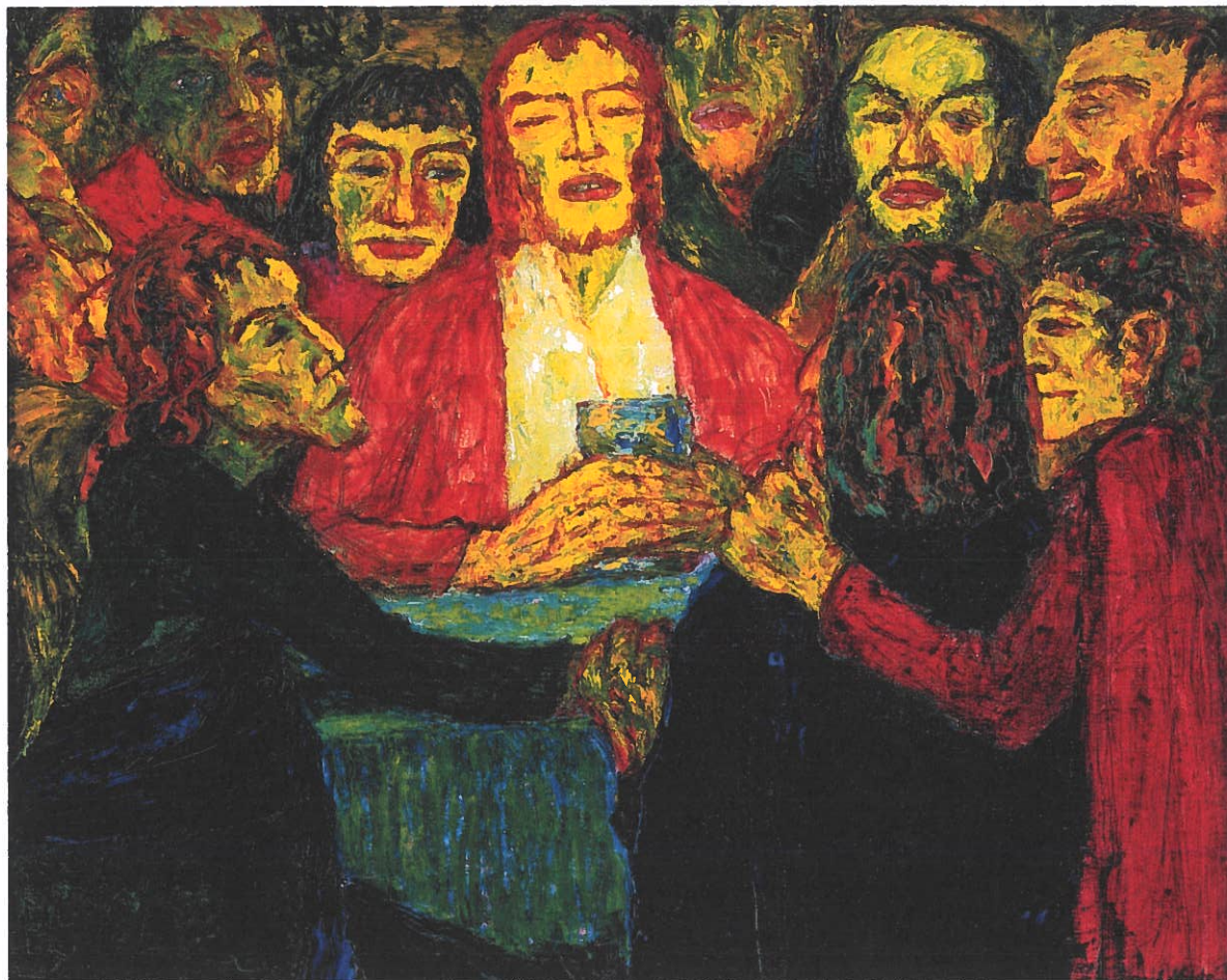
Emil Nolde: Nadverbillede , 1909. Olie på lærred, 86,3 x 106,8 cm

at sanse virkeligheden og dernæst omsætte den i overrumplende æstetiske udtryk.