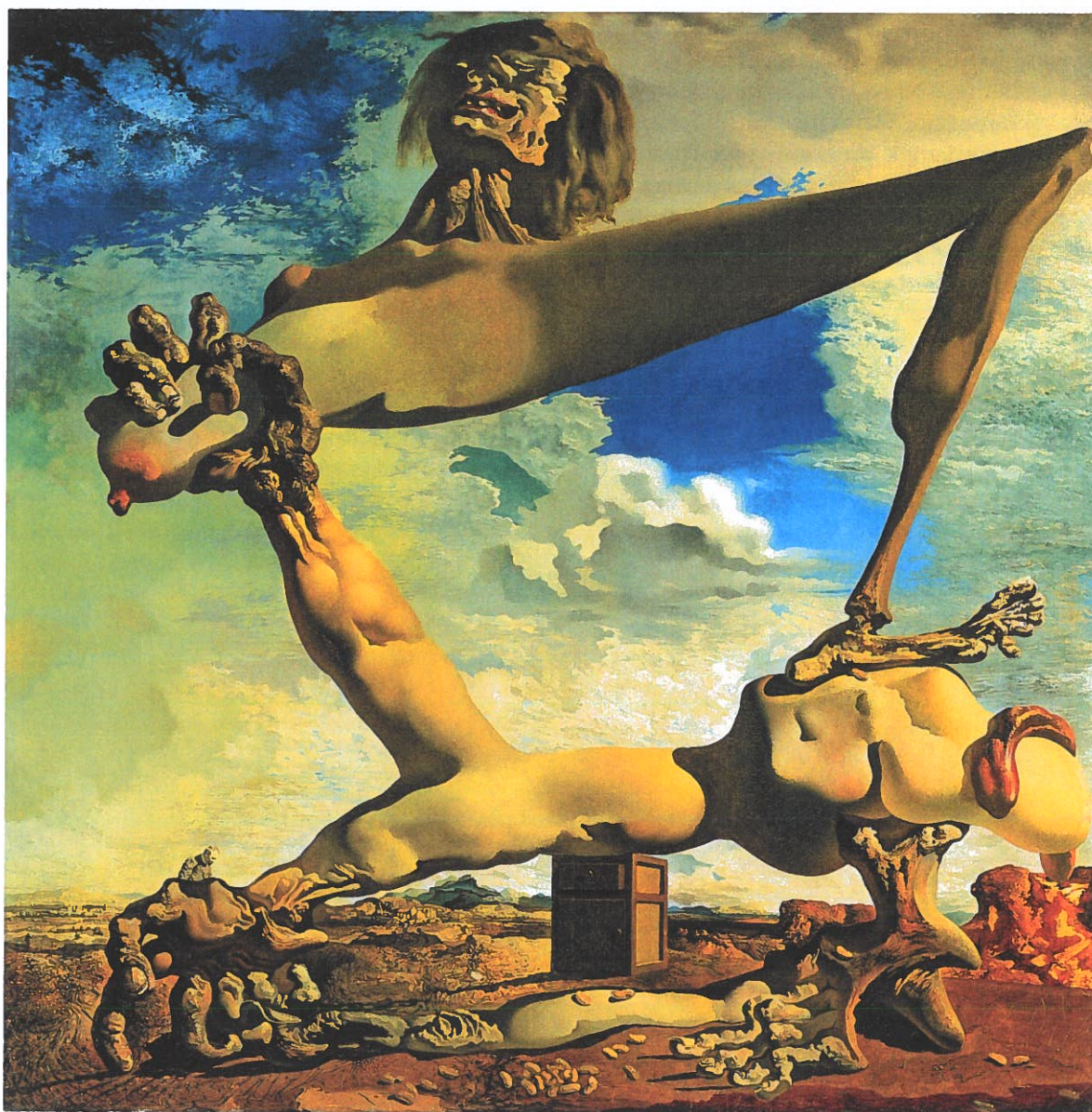
Salvador Dalí: Blød konstruktion med kogte bønner. Forudtelling om borgerkrigen, 1936. Olie på lærred, 100,5 x 100,5 cm

nde i den kamp mod fascismen, der ikke stopper med borgerkrigens afslutning.