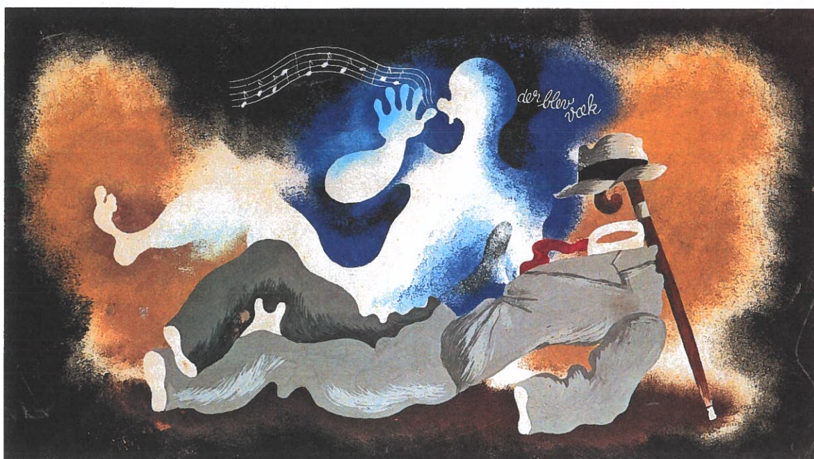
Kjeld Abell: Udkast til fortæppet til Melodien, der blev væk , 1935. Gouache, 29,6 x 52,6 cm

Kort efter findes han skudt i en vejgrøft. Munk er i litteraturen især kendt for sine skuespil om individet stillet over for store moralske konflikter. Dramaer om tro og tvivl. Hans kendteste værk er Ordet fra 1932. Dette drama er senere filmatiseret af Th. Dreier.