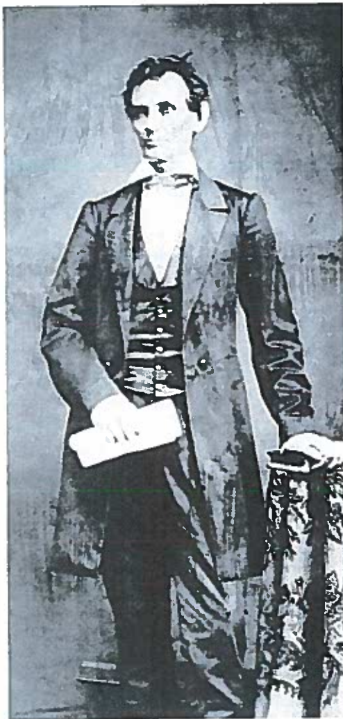
Abraham Lincoln, 1858.

Lincoln spørger Douglas, hvordan han kan forene folkets ret til selv at afgøre, om der skal være slaveri i de nye stater, som vedtaget i Kansas-Nebraska Loven, med Højesterets afgørelse i Dred Scott sagen, der sagde, at slaveriet ikke kunne forbydes noget sted i USA. Douglas svarer, at Højesteret ikke kan afgøre enkeltstaternes holdning til f.eks. slaveri. Hvis befolkningen i en enkeltstat er imod slaveriet, kan det ikke eksistere dér, hvad enten det er lovligt eller ej.