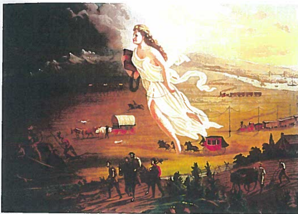
John Gast: "American Progress" 1872.

man enige i både Syd og Nord. Derfor var der brug for mere land, og i løbet af første halvdel af 1800-tallet købte eller erobrede USA resten af det nordamerikanske kontinent fra Mississippifloden til Stillehavet.