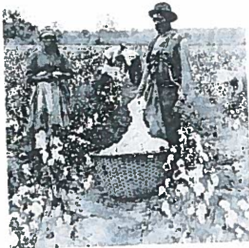
Slaver plukker bomuld i Syden. Fotografi fra 1800-tallet

den hvide mands overlegenhed i forhold til den sorte slave. Et angreb på slaveriet blev set som et angreb på Sydens samfundssystem, livsstil og identitet.