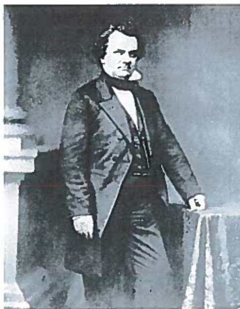
Stephen A. Douglas, 1858.

Mr. Lincoln prøver at undgå hovedspørgsmålet ved at angribe sandheden i mit udsagn om, at vore forfædre skabte denne regering delt mellem frie stater og slavestater og anerkendte hver stats ret til selv at afgøre alle de lokale spørgsmål. (...) Jeg bekymrer mig mere om selvbestemmelsens fornemme princip, folkets ret til at regere, end jeg gør for alle negre i den kristne verden. Jeg ville ikke bringe denne Unions evighed