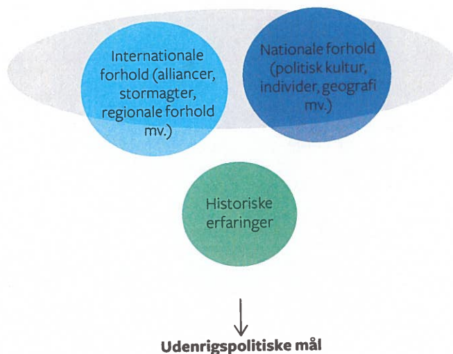
Figur 5.2 Faktorer, der former en stats udenrigspolitiske mål

For realismen (se kapitel 2) er de nationale interesser relativt uforanderlige over tid. Realister mener generelt, at det er enhver stats væsentligste interesse at opnå magt og sikre statens overlevelse. Derefter kan staten forfølge udenrigsøkonomiske og idepolitiske mål. Realisten Robert Pastor har således rangeret de udenrigspolitiske mål på en linje fra de målsætninger, der anses for at være vitale, til de mere ønskværdige (se figur 5.3).