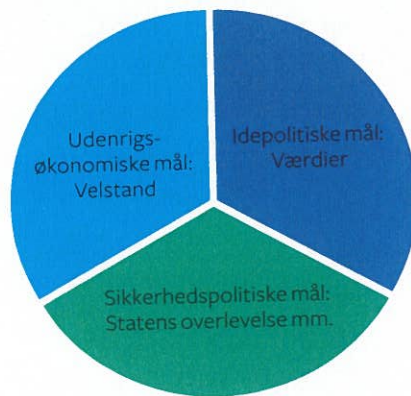
Figur 5.1 Udenrigspolitiske mål

også være i konflikt med hinanden, og stater må ofte prioritere mellem dem, når de tager udenrigspolitiske beslutninger: Hvis Danmark vil handle med Kina, er det eksempelvis nødvendigt at nedtone kritikken af menneskerettighedssituationen i den asiatiske stormagt. De udenrigspolitiske mål hænger derfor tæt sammen.