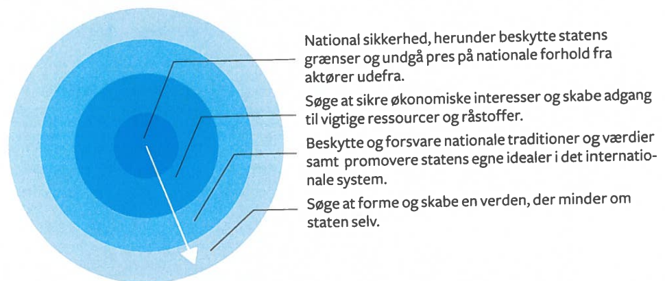
Figur 5.3 Realismens prioritering af de udenrigspolitiske mål

Note: Figuren læses indefra og ud. Jo nærmere kernen, desto mere vigtigt udenrigspolitisk mål.