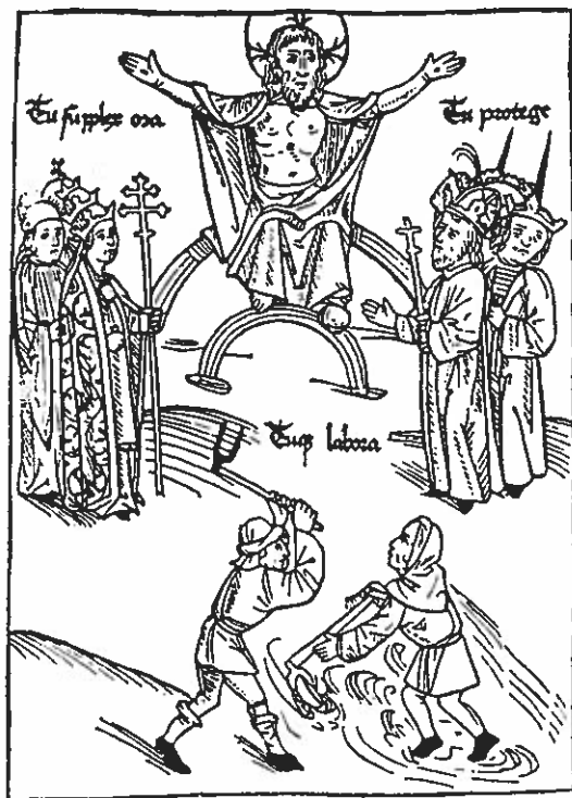
Verdensdommeren Kristus giver, siddende på en regnbue, middelalderens tre stænder deres opgaver. Kirken med paven i spidsen skal bede. Adelen, kongerne og kejseren skal beskytte, mens bønderne skal arbejde. Tysk træsnit fra slutningen af 1400-tallet.

og adelen efterspurgte også i stigende grad luksusprodukter. Med den stigende efterspørgsel på håndværksfremstillede varer blev der flere og større byer. Handelsvejene blev udvidet og skibstrafikken på Middelhavet, Østersøen, Atlanterhavet og de europæiske floder voksede.