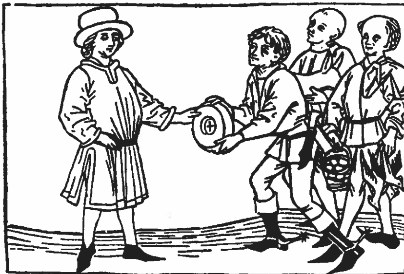
Bønder afleverer landgilde til godsejeren i form af ost, æg, lam og fjerkræ. Træsnit fra midten af 1400-tallet.

Særlig katastrofal blev den sorte død, der ramte Italien i midten af 1300-tallet, og som derfra bredte sig til det øvrige Europa. Det var en pestsygdom, der spredtes med rekordfart. Pestens hærgen skabte mangel på arbejdskraft. For de overlevende var det lettere at få arbejde, og lærde begyndte at diskutere, hvordan pest kunne