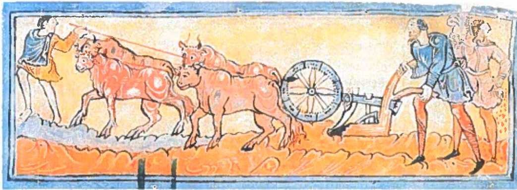
Bønder der pløjer med en hjulplov og sår. Kalenderillustration, o. 1050.

gengæld skulle stille soldater og riddere til kongens hær. En kronvasal kunne udlåne dele af sin jord til andre herremænd, de såkaldte vasaller. Forholdet mellem kongen og kronvasallen blev højtideligt bekendtgjort ved, at kronvasallen lovede kongen troskab med hånden på bibelen. Gud blev derved inddraget i handlingen og bekræftede troskabseden. En vasal under en kronvasal skulle også love troskab og stille med krigere til kronvasallen. En kronvasal og en vasal kaldes også lensherre. Lensherrernes indtægter byggede på bøndernes arbejde og de skulle håndhæve retten og beskytte indbyggernes liv i deres område.