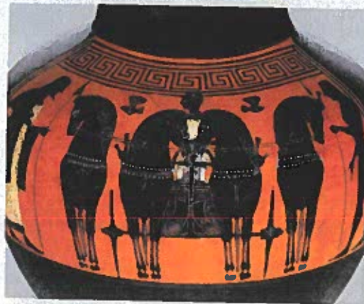
Væddeløb med fire heste var en prestigesport for de allermest velhavende, og normalt kørte ejeren ikke selv vognen. Her har vasemaleren afbildet et firspand klar til start, set lige forfra. Attisk sortfigurs kande, ca. 550-530 f.v.t.

Både de Seksten Kvinder og deres hjælpere er gift. Legenes oprindelse kan føres tilbage til den ældste tid. Man fortæller nemlig, at Hippodameia, da hun var blevet gift med Pelops, i taknemlighed over for Hera samlede de Seksten Kvinder og oprettede de heraiske lege (...). De Seksten Kvinder afholder desuden to dansekonkurrencer.