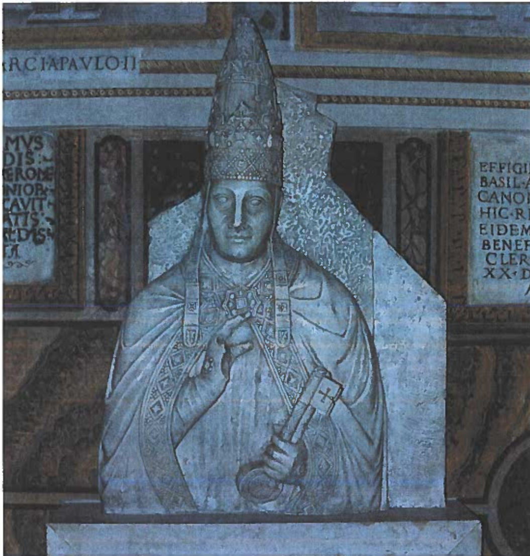
Arnolfo di Cambio, Buste af pave Bonifacius d. 8., 1294. Fra krypten under Peterskirken, Vatikanet.

Middelaldermennesket var besat af tanken om laster og synder. Hengav man sig til forskellige laster og synder, blev man ikke frelst, og den evige fortabelse i helvede ventede. Førte man derimod et kristent liv og angrede sine synder, ventede evigheden i himlen. Dommens dag og skærsilden kom med døden. Det gjaldt derfor om at forberede sig til dommens dag. Mange af middelalderens prædikener handlede da også om: helvede, død, himmel, dom og nådemidlerne, for det var her kirken som institution kunne hjælpe.