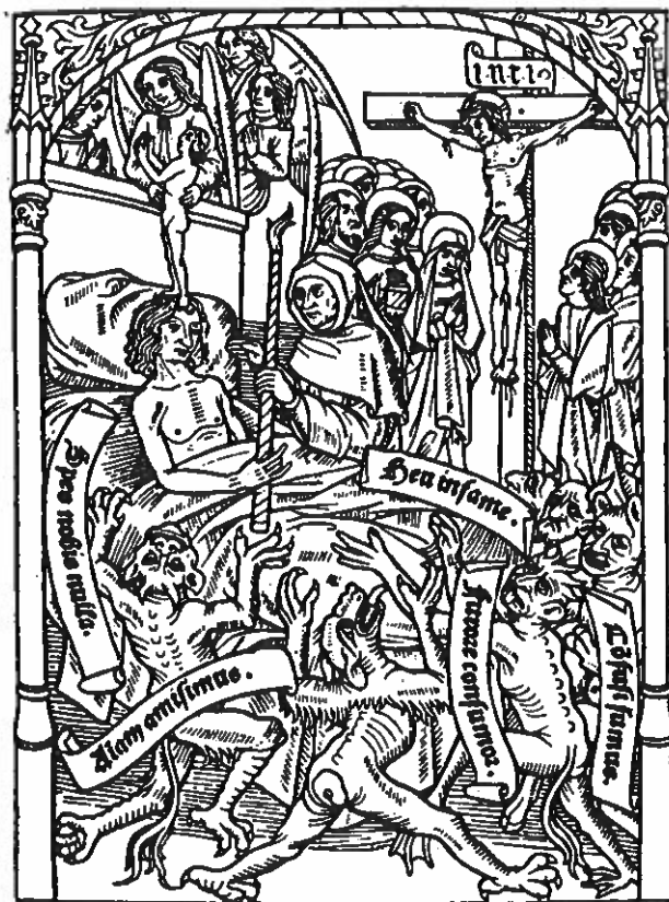
En kristen dør. Den døende mand, som har troet på den korsfæstede Kristus, beroliges af en munk. En engel tager hans sjæl, her symboliseret ved et barn, op til himlen. Nederst raser seks djævlø over, at de ikke fik ham med i helvede. Fransk træsnit fra 1493.

Mennesket skulle føre et fromt liv og kunne derved bidrage til sin egen frelse. Dødsøjeblikket så man som en kamp mellem dæmoner og