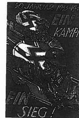
Fascistisk propaganda-kunst: »Ein Kampf, ein Sieg!«, 1943.

Fascismen kunne selvfølgelig mærkes i Danmark, også før 9. april 1940, men den blev aldrig nogen egentlig trussel imod