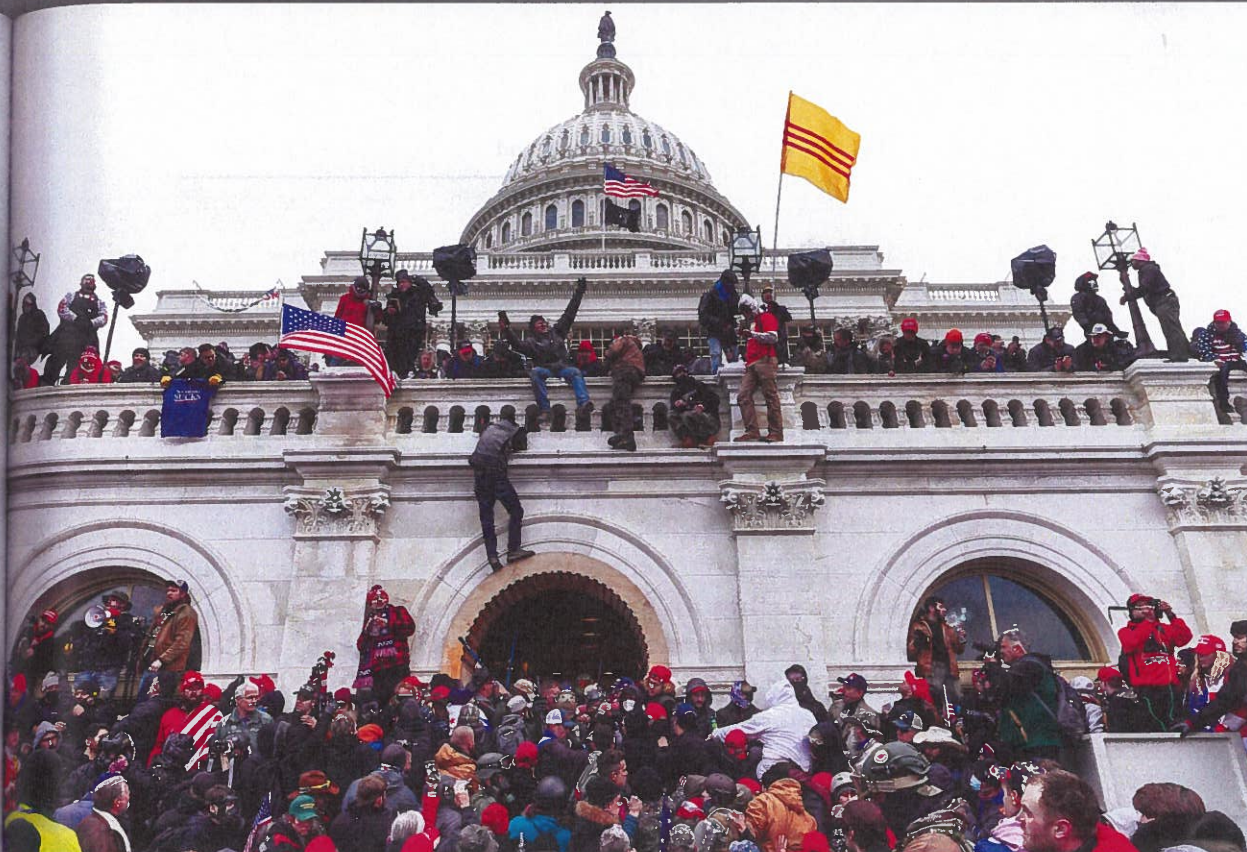
Stormen på Kongressen i Washington D.C. efter præsidentvalget i 2021. Donald Trump (f. 1946) havde været præsident siden 2016 og anerkendte ikke valgets udfald, men påstod, at Joe Biden (f. 1942) havde stjålet hans sejr.

ge version er blevet manipuleret om til et hagekors. Troværdigheden var dog lav for alle, der vidste, at Zelenskij selv er af jødisk afstamning, og at det er så godt som usandsynligt at finde nazistiske jøder.