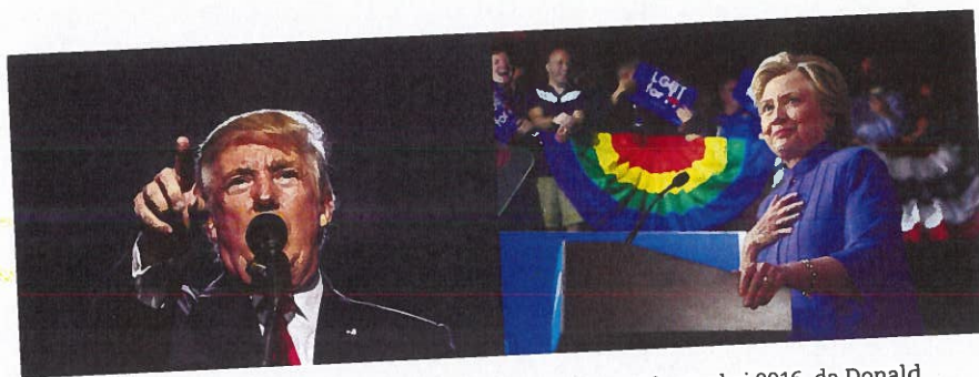
Fake news blev en magtfaktor under det amerikanske præsidentvalg i 2016, da Donald Trump (f. 1946) fandt på løgne om sin modstander Hillary Clinton (f. 1947) og vandt valget.

bag debatpalterne på en avis. Hvis man sender et debatindlæg ind til en almindelig avis, bliver man vurderet for sine skriveevner, relevans for nyhedsmediet og offentligheden. Hvis man får optaget et debatindlæg, kan man blive bedt om at redigere dette. Man kan også blive afvist af redaktionen.