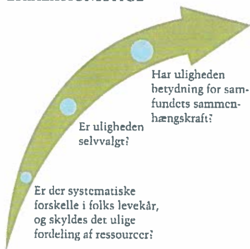
FIGUR 1.3 ULIGHEDENS ESKALATIONSSTIGE

af, at de i virkeligheden er selvforskyldt. Debatten om Dovne-Robert, som bliver behandlet i kapitel 2, er et eksempel på det. Her så vi at danskerne generelt var tilfredse med kontanthjælpen for Robert-sagen, men ændrede kortvarig holdning efter sagen, som følge af at flere begyndte at anskue kontanthjælpsmodtagernes situation som selvforskyldt.