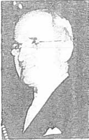
Harry S. Truman (1884-1972) USA's præsident 1945-52. Demokrat. Trumans budskab til kongressen betegner et vendepunkt i amerikansk udenrigspolitik: Isolationismen blev afløst af et verdensomspændende engagement.

Folk i mange af verdens lande har nylig fået pålagt totalitært styre imod deres vilje. De forenede Staters regering har hyppigt protesteret mod tvang og tryk, mod krænkelse af Jaltaaftalen i Polen, Rumænien og Bulgarien. Jeg må også fastslå, at der har været en lignende udvikling i et antal andre lande.