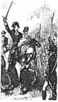
Uafhængigheds- erklæringen læses op for amerikanske soldater. Samtidigt træ- snit.

nisk regering. Det var tanker, der i høj grad stammede fra den engelske tradition ikke mindst fra forfatteren John Locke.