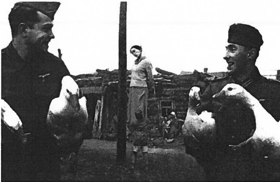
Tyske soldater der står med gæs og smiler foran hængt kvinde, Rusland 1943

Men hvad så med personalet i udryddelseslejrene, der udførte ordrene og direkte håndterede udryddelsen af jøderne? Ifølge Milgram må de jo have haft særligt store samvittighedskvaler, eftersom de var tæt på ofrene og konfronteret direkte med konsekvenserne af deres handlinger. Forholder det sig også sådan i virkelighedens verden? Nej, næsten tværtimod ifølge forskellige kilder.