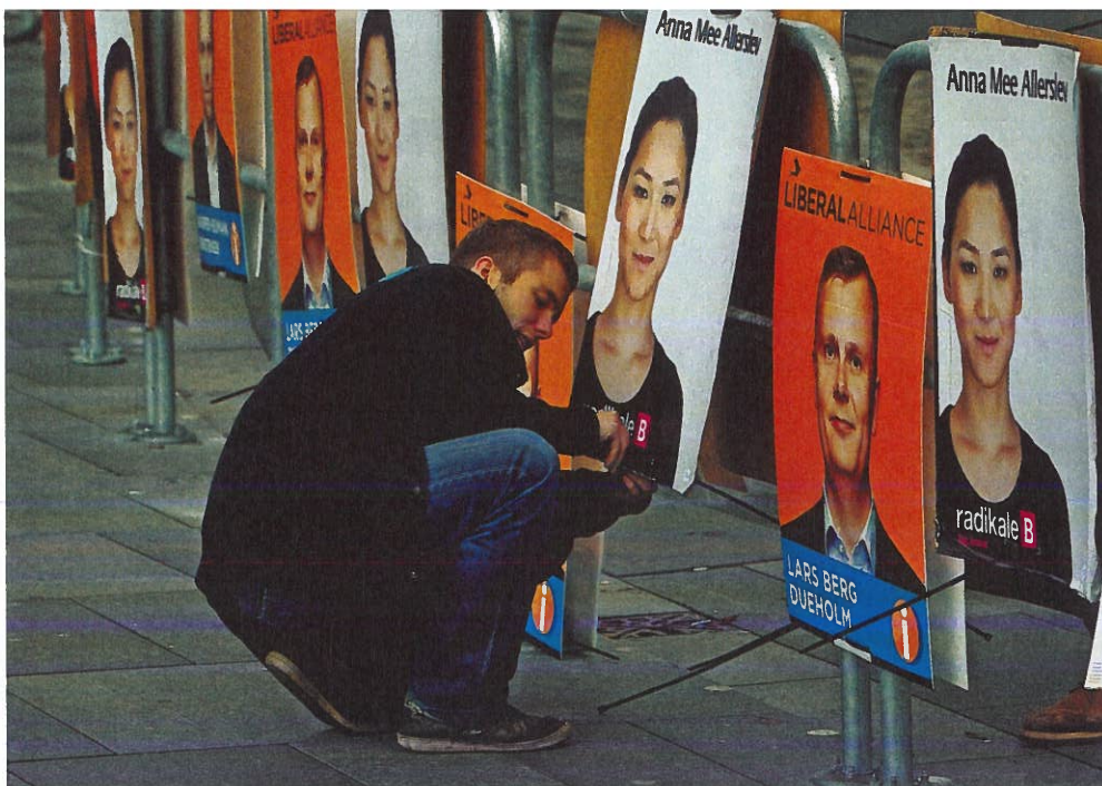
■ Når valget nærmer sig, hænges plakater op rundt om i landet. Her ses valgplakater fra København i 2013.

valg. En lokalliste kan for eksempel blive til på baggrund af en særlig lokal mærkesag eller for at tage sig af et bestemt geografisk område. Man kan argumentere for, at det er demokratisk godt, at der findes en mulighed for at stille op uden om de etablerede partier. På den anden side kan det problematiseres, at lokallisterne ikke har et decideret bagland i traditionel forstand, som et parti har. Derved kan man sætte spørgsmålstegn ved lokallisters legitimitet.