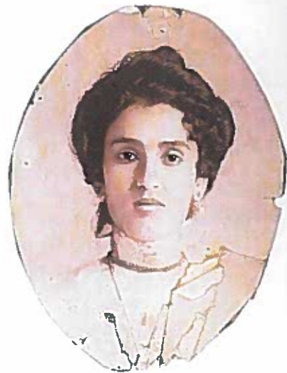
La madre de Frida

Según Frida, Matilde era una mujer inteligente, muy simpática, pero