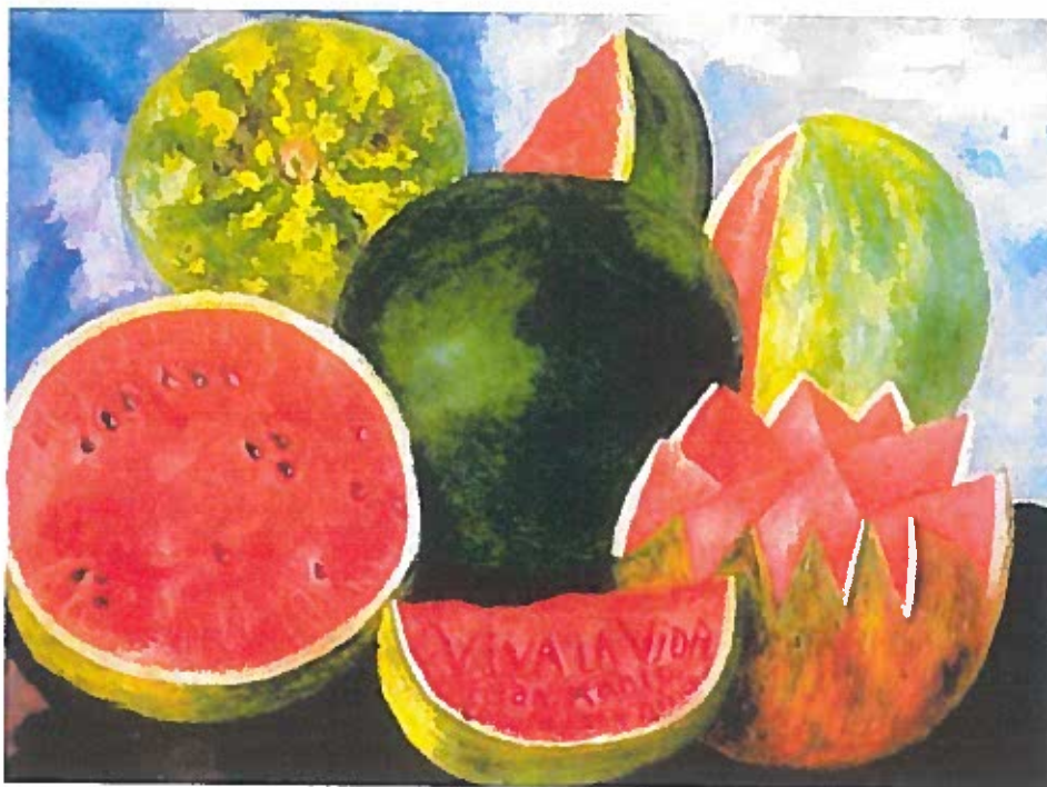
Frida Kahlo. Viva la vida , 1954