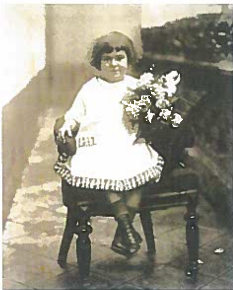
Frida a los cuatro años. San Francisco, California, 1940

Frida era morena. Sus ojos eran marrones. Tenía las cejas tupidas y juntas. Tenía la nariz recta. Era baja. En la foto de niña lleva un delantal blanco y zapatos negros. Tiene el pelo corto y liso. Está sentada y sonríe. En la mano izquierda tiene un ramo de flores. En la otra foto, lleva una blusa blanca con motivos de la naturaleza, lleva también un rebozo y pendientes. En la mano izquierda lleva anillos. En el pelo lleva un tocado de flores. En la foto de niña tiene cuatro años y en la otra tiene 33 años.