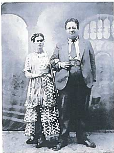
Diego Rivera y Frida Kahlo el día de su boda, 21 de agosto de 1929

había nacido el año 1910, el año que estalló la Revolución. Frida nació, en realidad, el 6 de julio de 1907.