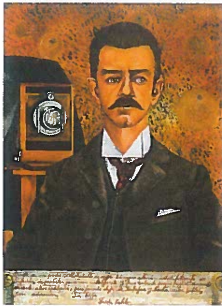
Frida Kahlo. Retrato de mi padre , 1951

generoso – gavmild valiente – modig, tapper porque – fordi padeció (præteritum af padecer) – han led af durante – i jamás – aldrig nogen sinde dejó de (præteritum af dejar de) – han holdt op med adoración f – tilbedelse aprendió (præteritum af aprender) – hun lærte enseñó (præteritum af enseñar) – han lærte fra sig utilizar – at bruge cámara f – fotografiapparat revelar – at fremkalde retocar – at retouchere colorear – at farvelægge Oaxaca – stat i Mexico descendiente f/m – efterkommer según – ifølge carácter m – personlighed, karakter cruel – ond calculador/-ora – beregnende llamaba (imperfektum af llamar) – hun kaldte a menudo – tit contar lo > uel – at fortælle, også tælle sabía (imperfektum af saber) – hun kunne leer – at læse ni – og heller ikke campanita f – blomst der ligner en klokke bordar – at brodere cocinar – at lave mad hacer la limpieza – at gøre rent se identificaba con – (imperfektum af identificarse con) hun identificerede sig med Revolución Mexicana – nationalistisk-demokratisk revolution, der brød ud i 1910 por eso – derfor siempre – altid decía (imperfektum af decir) – hun sagde que conj. – at que pron. – som; der