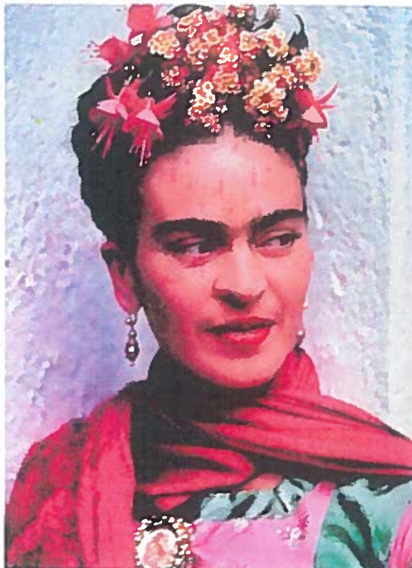
Frida - Coyoacán - 1938