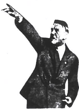
Hitler, den 31. januar 1933.

Chof for et nazistisk-tysknationalt Kabinot