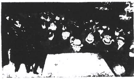
Parlamentet den 31. januar 1933. I midten: Statsministeren og Folketingsformanden. Til højre: Rigsretspræsidenten og Rigsadvokaten.

RENTESÆNKNING OG STORE BELØB TIL KONVERTE- RING OG OFFENT- LIGE ARBEJDER