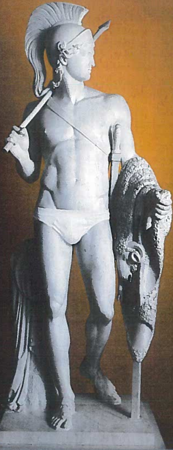
Bertel Thorvaldsen: "Jason med det gyldne skind", 1802-03 Elmgreen & Dragset: "Jason (Briefs)", 2009.

Uddrag fra "TAP" af Bay Andersen m.fl., PRAXIS, 2021