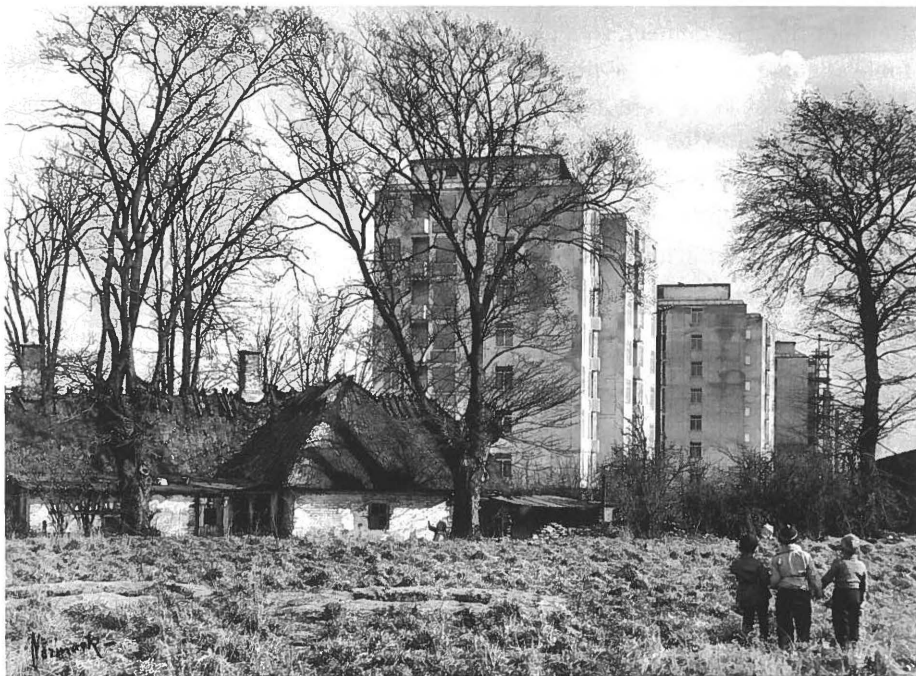
Efter besættelsen var der et stort behov for nye og mere moderne boliger. Her ses boligblokke i udkanten af Odense i 1950'erne. I forgrunden ses resterne af det gamle landbrugssamfunds mere primitive boligformer. De tre børn nærmest 'kigger ind i fremtiden'.

uden vurdering af trang og værdighed – også kaldet universelle ydelser. Hvis alle sociale grupper var med i projektet, kunne man således styrke den sociale sammenhængskraft i samfundet og desuden sikre en bred opbakning til velfærdsstaten, ikke mindst i den voksende middelklasse.