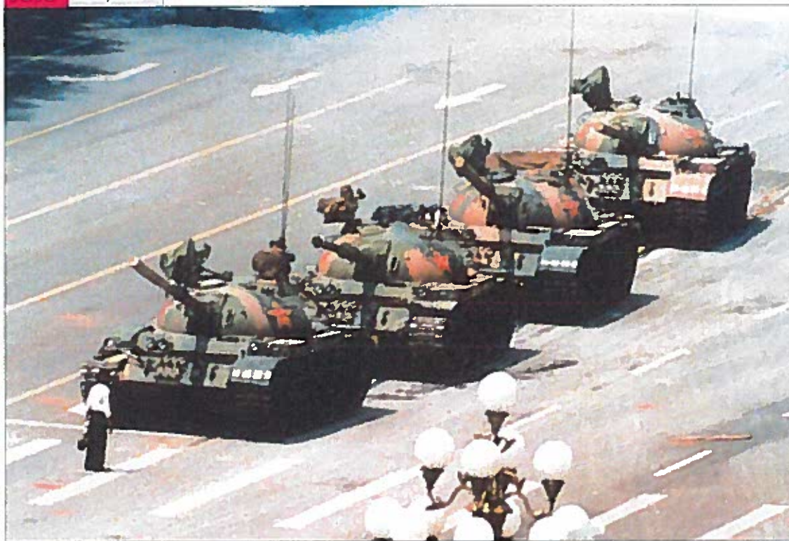
FOTO Kina, 1989

Billedet som ikon: Nogle dokumentariske billeder opnår at blive historiske symboler. Under demonstrationerne mod det kommunistiske styre i Kina i 1989 stiller en mand sig op foran de fremrykkende kampvogne på Den Himmelske Freds Plads. Oprøret blev knust, men et ikon på viljen til modstand er forevigt.