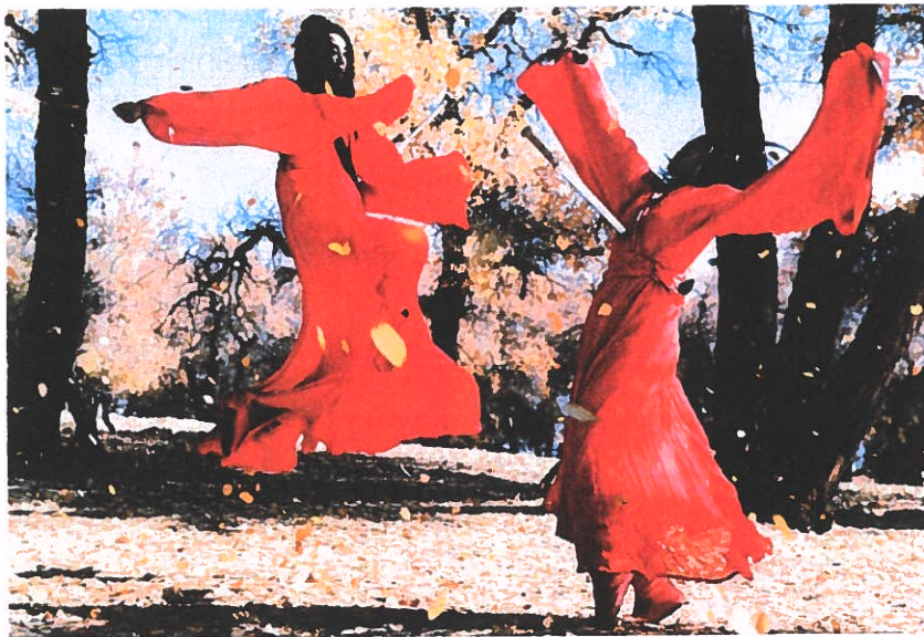
Et billede fra Zhang Yimous poetiske "wuxia"-film Ying xiong (2002, Hero ).

Hero handler om en gruppe lejemandere, der sværger at tage livet af kongen af Qin (Chen Daoming) – en tyrannisk skurk der med sin drøm om et "tusindårsrige" næsten kunne minde om Adolf Hitler. Den er mere hongkong-kinesisk inspireret i sin billedæstetik end Ang Lees film, hvilket kan ses i det glidende kameraarbejde, farverigdommen og den hektiske klipning, der skifter mellem evigt nye perspektiver i en blanding af hastige billedekspllosioner og lyrisk opsatte passager. Allerede fra filmens anslag dyrkes de spektakulære stunts, og de flagrende klædedragter og den velkoreograferede action ophøjer kampsporten til en berusende ballet.