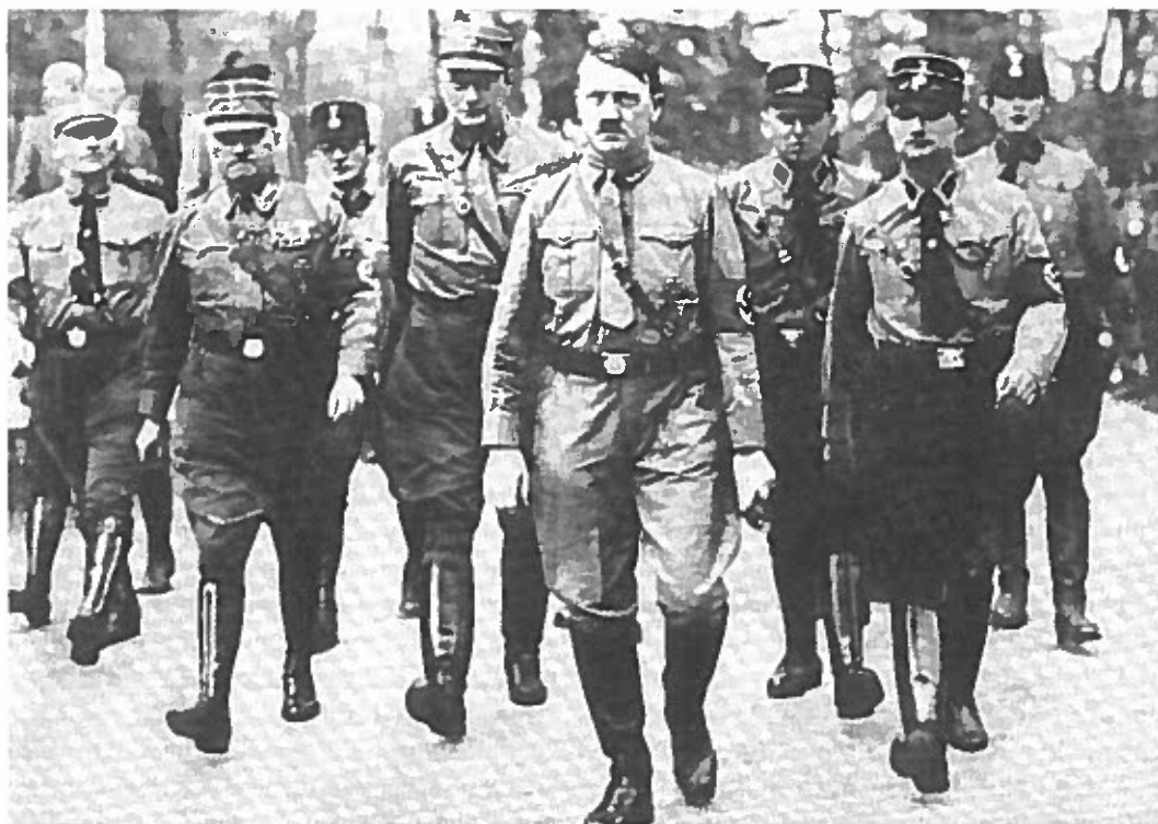
Hitler i spidsen for sin stab i Bad Harzburg under valgkampen i 1930.

Den grundsætning, der i sin tid gjorde den prøjsiske hær til det tyske folks vidunderligste redskab, skal i