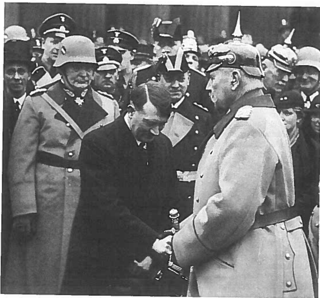
Hitler hilser på præsident von Hindenburg i 1933. Herman Göring og Joseph Goebbels ser til i baggrunden.

I stedet blev von Schleicher den 2. december 1932 selv udnævnt til rigskansler. At udnævne en general fremfor en politiker som leder af republikken var i virkeligheden det samme som at skrive Weimarrepublikkens dødsat-