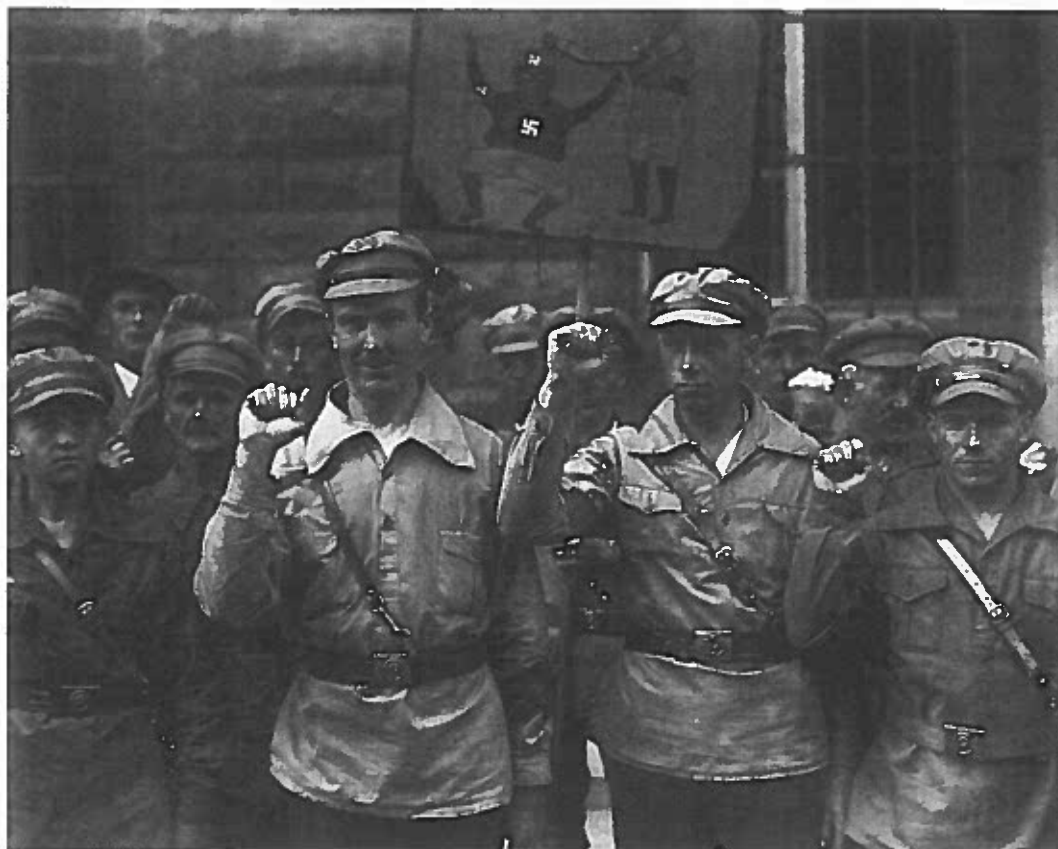
Den økonomiske krise i Tyskland førte til en stigende tilslutning til den yderste højrefløj og venstre- fløj. Her kommunisterne, der havde kraftig fremgang 1930-33.

0 30 skulle der væ- ed "uro, trang, blomstre vores af- bels, og ved val- nu høstes. Nazis- assiv og aggressiv beherske den of- armende og vold- ationer, masse- angreb de syste- ske modstandere, defensiven. gennemgående te- tiske system, som len for krisen og . Hitler gav i sine e lette forklaring- iv ingen konkrete zisterne ville løse de kriseramtes fø- ornuft, og gav de