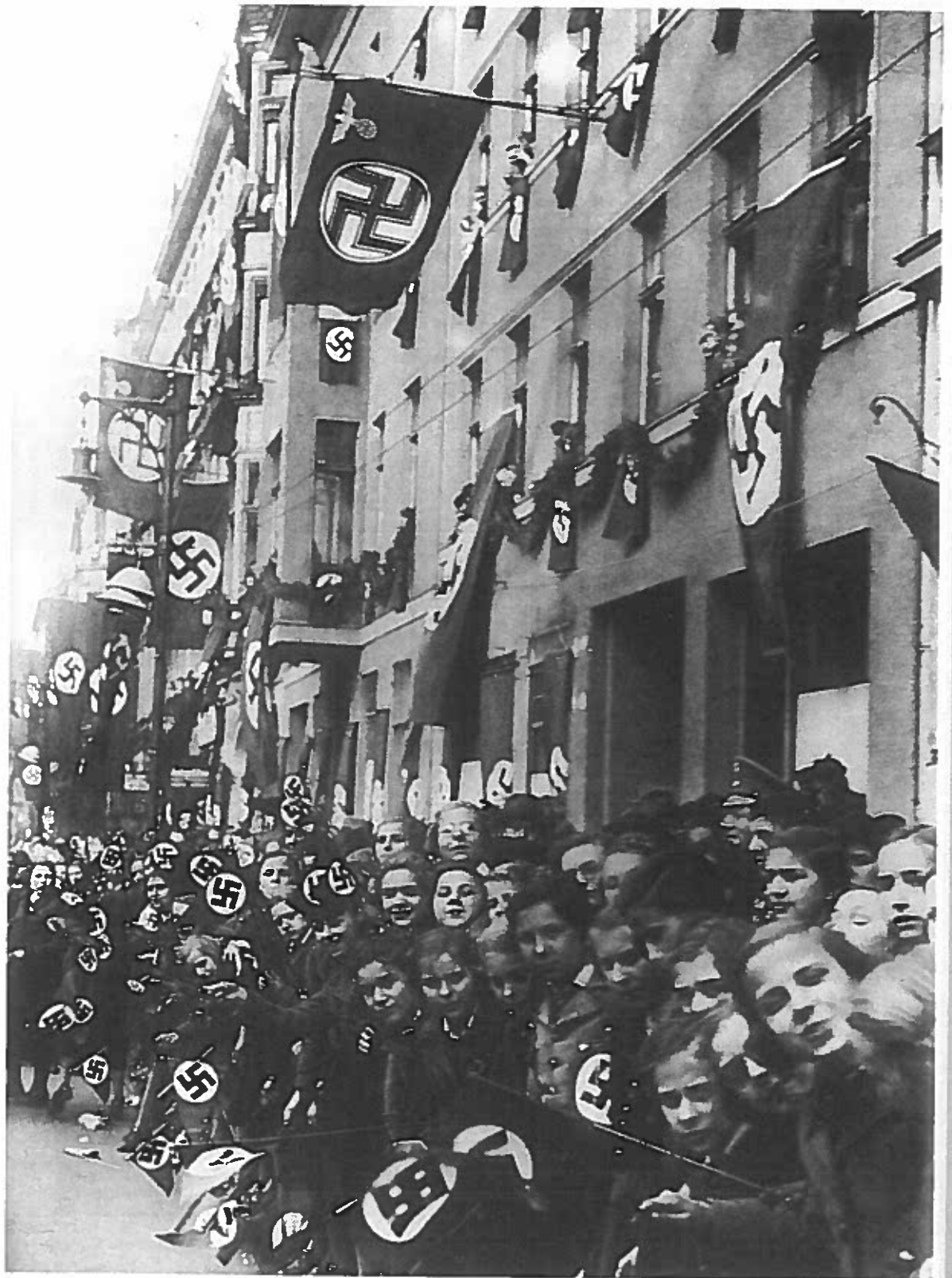
Befolkningen venter begejstret på Hitlers ankomst i 1933.