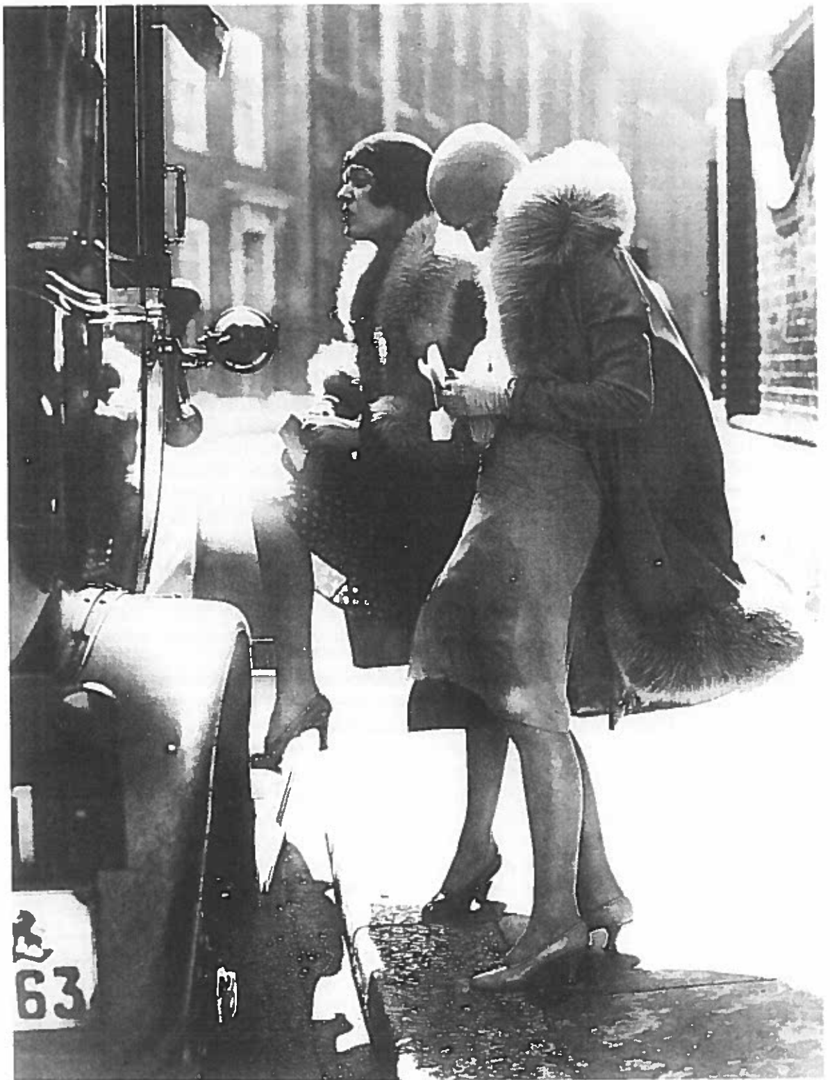
I Weimarrepublikkens Tyskland blev kvinderne moderne og mere selvbevidste, udadvendte og økonomisk uafhængige. Samtidig blev prostitutionen en almindelig del af gadebilledet. Det kan diskuteres om billedet forestiller to overklasse-kvinder eller to prostituerede. Hvad på billedet taler for, at kvinderne er prostituerede? Berlin 1929.