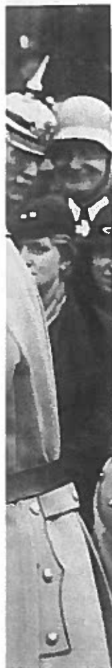
s ser til i bag-

cher den 2. vnt til rigs- eneral frem- af republik- samme som ens dødsat-