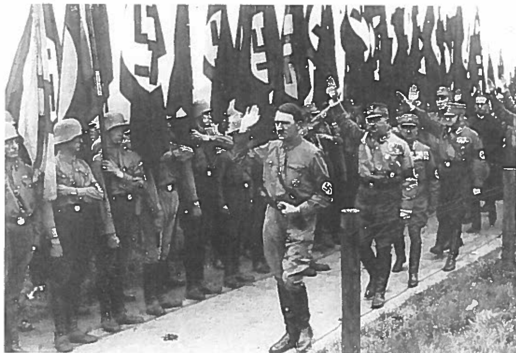
Hitler og SA-lederen Röhm hilses velkommen til partisammenkomsten „Das Harzburger Treffen“ i Bad Harzburg i oktober 1931.

fra offentlige og statslige stillinger. De udrensede embedsmænd blev erstattet af nazister. Også lovgivningsmagten var totalt domineret af nazistpartiet efter forbudet mod de politiske partier i sommeren 1933. Men den tyske regering bestod helt frem til 1937 også af ikke-nazistiske ministre. Økonomi-, finans-, udenrigs- og forsvarsministerne var konservative politikere.