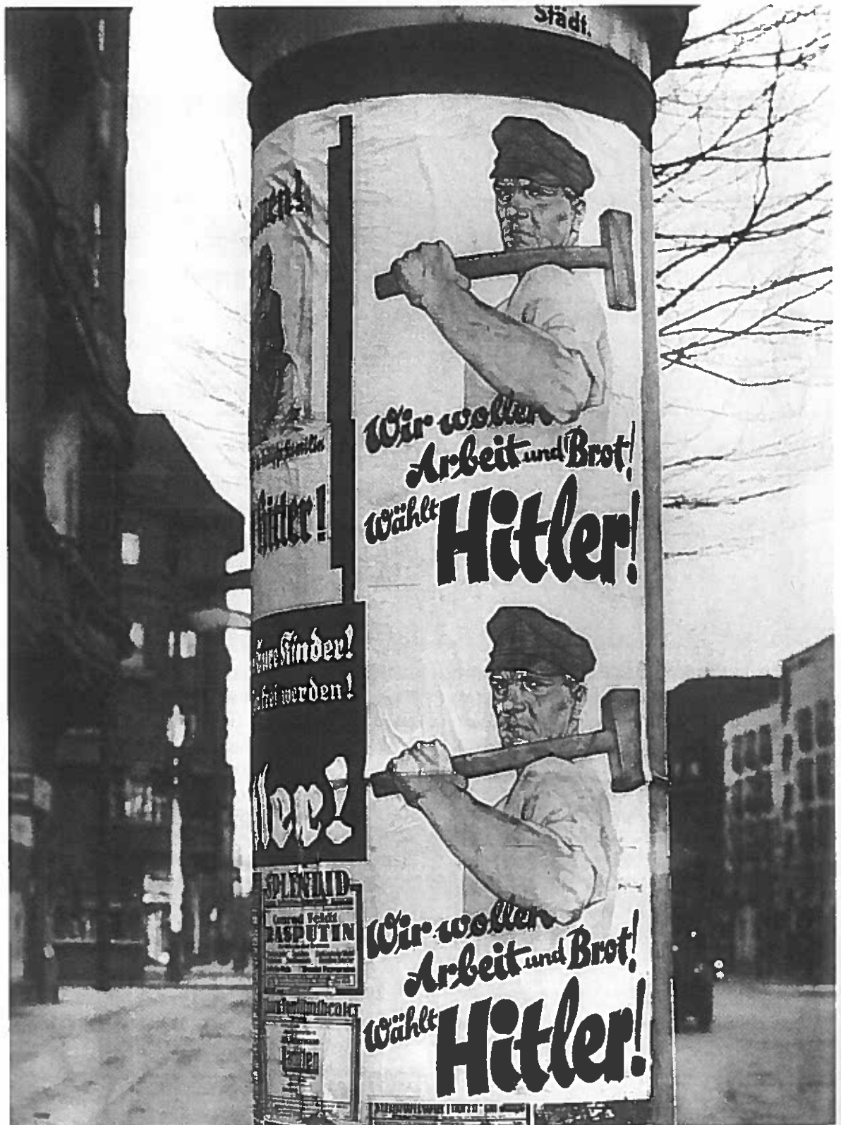
Nazistisk plakat fra rigspræsidentvalget i marts/april 1932.