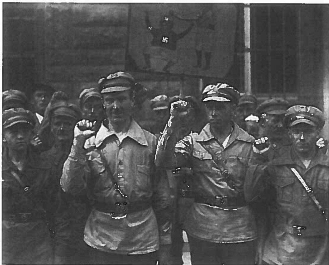
Den økonomiske krise i Tyskland førte til en stigende tilslutning til den yderste højrefløj og venstre- fløj. Her kommunisterne, der havde kraftig fremgang 1930-33.

0 30 skulle der væ- ed "uro, trang, blomstre vores af- bels, og ved val- nu høstes. Nazis- assiv og aggressiv beherske den of- armende og vold- ationer, masse- angreb de syste- ske modstandere, defensiven. gennemgående te- tiske system, som len for krisen og . Hitler gav i sine e lette forklaring- iv ingen konkrete zisterne ville løse le kriseramtes fø- ornuft, og gav de