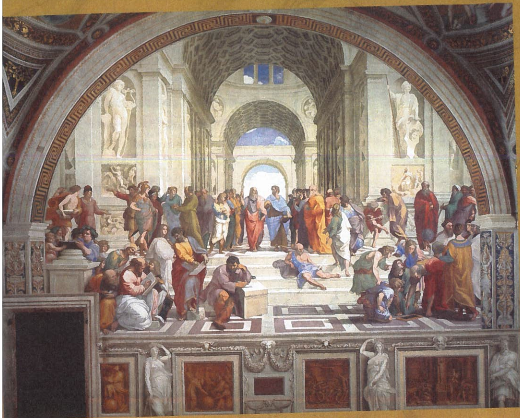
Dette maleri af renæssancemaleren Raphael (1483-1520) viser Akademiet i Athen med Platon, Sokrates, Aristoteles og flere andre filosoffer - og Raphael selv. Det afspejler den ophøjede status, græske filosoffer havde i renæssancen, hvor antikken blev genfødt - deraf ordet renæssance.